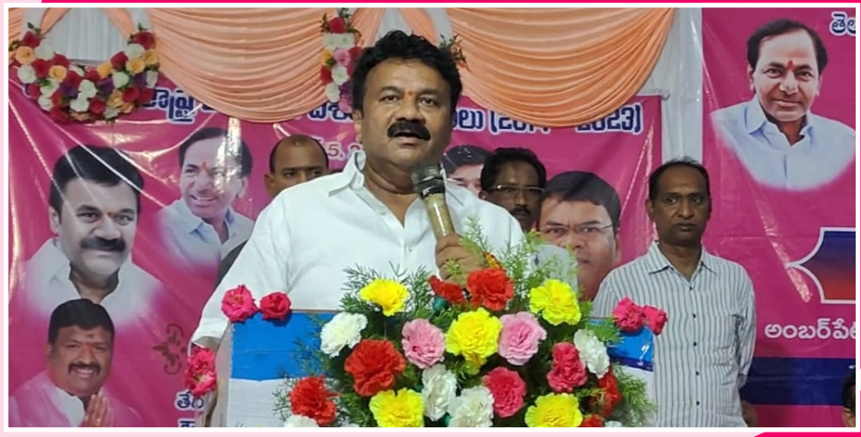
విజయోత్సవ సభలో మాట్లాడుతున్న మంత్రి తలసాని