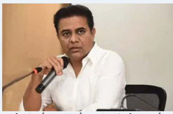
ప్రాజెక్టుని కేంద్రం రద్దు చేసినా, ఈ ప్రగతి సాధ్యం అయ్యేలా చూడగలిగామన్నారు. డింతోపాటు దాదాపు రెండు సంవత్సరాల పాటు కరోనా సంక్షోభం ఆ తర్వాత మారిన పరిస్థితులను

వార్షిక నివేదికను విడుదల చేసిన మంత్రి కేటీఆర్ ఇయ్యాలి స్టూన్, హైదరాబాద్, జూన్ 5: ఐటీ రంగంలో హైదరాబాద్ నగరం శరవేగంగా దూసుకుపోతోందని, ఈ రంగంలో ఎంతో పురోగతి సాధించామని తెలంగాణ రాష్ట్ర ఐటీ, పరిశ్రమల శాఖ మంత్రి కేటీఆర్ అన్నారు. డి హబ్ లో ఐటీ శాఖ 9వ వార్షిక నివేదికను మంత్రి విడుదల చేశారు. తెలంగాణ రాష్ట్రం ఏర్పడిన తొలిసారిలో రాష్ట్రాన్ని ఐటీ రంగంలో అగ్రస్థానంలో నిలబెడతామన్నప్పుడు అనేకమంది ఆశ్చర్యంగా చూశారని, అయినా ఈరోజు దేశ ఐటీ రంగంలో హైదరాబాద్ అగ్రస్థానంలో నిలిచేందుకు తమ ప్రభుత్వం అనేక ప్రయత్నాలు చేసిందన్నారు. గత పది సంవత్సరాలలో కేంద్ర ప్రభుత్వం సహాయనిరాకరణ చేసినా, ఈ రంగంలో అద్భుతమైన ప్రగతిని సాధించగలిగామని, హైదరాబాద్ ఐటీ రంగానికి ఎంతగానో ఊతం ఇస్తుందనుకున్న ఐటీఐఆర్