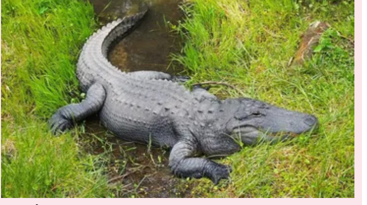
ఉందని తేలింది. ఈ బుల్లి మొసలి తల్లిలా ఉందని శాస్త్రవేత్తలు తెలిపారు. అయితే ఇప్పుడు పుట్టిన మొసలి మగ, ఆడ అనే అధరాలు తెలియట్లే ఉందని. చెప్పిన శాస్త్రవేత్తలు ఈ చిన్న మొసలి గురించి మాట్లాడుతూ.. ఇది ఫ్యాకల్టేటివ్ పార్టికోజెసిస్ ఫలితమని పేర్కొన్నారు. దీని కారణంగా ఈ బిడ్డ తల్లిలా పూర్తి లేదా సగం క్లౌన్ లాగా కనిపిస్తుంది.

ఇయ్యాలి న్యూస్, వెబ్ డెస్క్, జూన్ 10: జీవి సృష్టి అనేక ఆడ, మగ కలయికతోనే అని.. మగ భాగస్వామి లేకుండా స్త్రీ గర్భం దాల్చడని అందరికీ తెలిసిన విషయమే.. ఈ నియమం మానవులకు మాత్రమే కాదు జంతువులకు కూడా వర్తిస్తుంది. అయితే భాగస్వామి తో పనిలేకుండానే గర్భం దాల్చడం సాధ్యమేనా అని ఎప్పుడైనా ఆలోచించారా? ప్రపంచం నలుమూల ఉన్న శాస్త్రవేత్తలు అలాంటి పద్ధతిని కనుగొనడంలో నిమగ్నమై ఉన్నారు. అయితే భాగస్వామి లేకుండానే ఓ ఆడ మొసలి గర్భం దాల్చిందని మీకు తెలుసా. ఇది వినడానికి మీకు వింతగా అనిపిస్తుందా? అయితే ఇది పూర్తిగా నిజం. ఆడ మొసలి గర్భవతి అని తెలుసుకున్న శాస్త్రవేత్త ఆశ్చర్యపోయాడు. ఎందుకంటే గుడ్డు పిండంగా మారడానికి స్పెర్మ్ అవసరం. రెస్ట్రెట్ పార్కులో నివసిస్తున్న 18 ఏళ్ల ఆడ మొసలి తోడు లేకుండా 16 సంవత్సరాలు ఒంటరిగా గడిపింది. అయితే ఆశ్చర్యకరంగా 2018 సంవత్సరంలో ఆ మొసలి 14 గుడ్డు పెట్టింది. వీటిలో 7 గుడ్డు పిండాలుగా మారే సామర్థ్యాన్ని కలిగి ఉన్నాయి. వాటిని మూడు నెలలు పోషించిన తరువాత ఆరు నాశనం అయ్యాయి. వాటిల్లో ఒకటి మిగిలిపోయింది. ఇప్పుడు అది గుడ్డు నుంచి మొసలి పుట్టింది. శాస్త్రవేత్తలు ఈ చిన్నారి మొసలి జననం గురించి పరిశోధించగా... ఈ పిండం సరిగ్గా ఆ ఆడ మొసలిలా ఉందని తేలింది. ఈ బుల్లి మొసలి తల్లిలా ఉందని శాస్త్రవేత్తలు తెలిపారు. అయితే ఇప్పుడు పుట్టిన మొసలి మగ, ఆడ అనే అధరాలు తెలియట్లే ఉందని. చెప్పిన శాస్త్రవేత్తలు ఈ చిన్న మొసలి గురించి మాట్లాడుతూ.. ఇది ఫ్యాకల్టేటివ్ పార్టికోజెసిస్ ఫలితమని పేర్కొన్నారు. దీని కారణంగా ఈ బిడ్డ తల్లిలా పూర్తి లేదా సగం క్లౌన్ లాగా కనిపిస్తుంది.