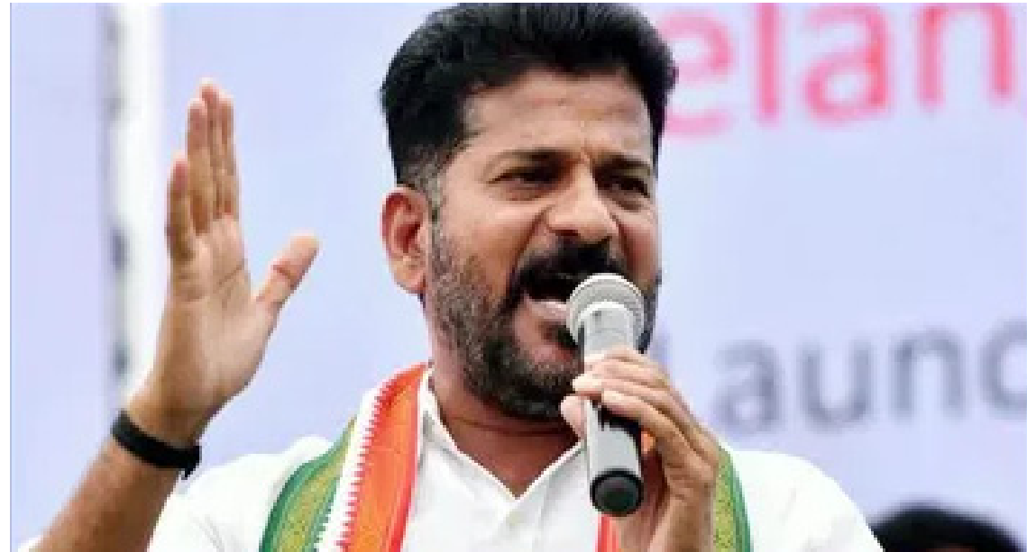
ఫ్యాంట్లు కట్టారన్నారు. నిషేధించిన టెక్నాలజీతో విద్యుత్ ఫ్యాంట్లు నిర్మించారు.. కమిషన్ కోసం విద్యుత్ సంస్థలను అప్పుపాలు చేశారన్నారు. విద్యుత్ సంస్థలను కేసీఆర్ కుప్పకూల్చారు.. కేంద్రం డాక్యుమెంట్లను సీ-మెన్స్ గ్రేడ్ లో తెలంగాణ ఉందనీ.. ఉచిత విద్యుత్ పేరుతో దోచుకుంటున్నారంటూ మండిపడ్డారు.

ఇయ్యాలి న్యూస్, హైదరాబాద్, జూలై 13: నా మాటలను కేటీఆర్ ఎడిట్ చేసి అతి తెలివి ప్రదర్శించారు.. దుష్ప్రచారం చేశారు.. ఉచిత విద్యుత్ పై బీఆర్ఎస్ తో చర్చకు సిద్ధం.. అంటూ డిపీసీసీ చీఫ్ రేవంత్ రెడ్డి పేర్కొన్నారు. వ్యవసాయానికి ఉచిత విద్యుత్ గురించి మాట్లాడిన మాటలను వక్రీకరించారంటూ డిపీసీసీ చీఫ్ రేవంత్ రెడ్డి కురిచి ఇచ్చారు. ఈ మేరకు గురువారం మీడియాతో మాట్లాడారు. తాను డిపీసీసీ చీఫ్ హెడాలోనే తానా సభకు హాజరయ్యానని.. కాంగ్రెస్ విధానాలను వివరించడానికి అక్కడికి వెళ్లినంటూ పేర్కొన్నారు. కేటీఆర్ నా మాటలను వక్రీకరించారు.. నా మాటలను ఎడిట్ చేసి కేటీఆర్ అతి తెలివి ప్రదర్శించారంటూ పైర్ అయ్యారు రేవంత్ రెడ్డి.. ఉచిత విద్యుత్ పై బీఆర్ఎస్ తో చర్చకు సిద్ధమని.. ఆనాటి బడ్జెట్ లో కాల్యాలకు కేసీఆర్ కారణమంటూ రేవంత్ పేర్కొన్నారు. ఉచిత కరెంట్ కు వ్యతిరేకంగా ఆనాడు కేసీఆర్ స్టేట్ మెంట్లు ఇచ్చారు.. బడ్జెట్ లో రైతులను కాల్చి చంపించిందే కేసీఆర్ అంటూ ఆరోపించారు. కాంగ్రెస్ వల్లే ఈరోజు తెలంగాణలో విద్యుత్ వెలుగులు అని పేర్కొన్నారు. కిరణ్ కుమార్ రెడ్డి ప్రెస్ మీట్ తర్వాత విద్యుత్ కోసం డిమాండ్ పోరాడారన్నారు. అందుకే, వినియోగం పద్ధతిన తెలంగాణకు 53శాతం విద్యుత్ పబ్లిండ్ నున్నారు. జనాభా ఎక్కువ ఉన్నా ఏపీకి 47శాతం విద్యుత్ కేటాయింపు ఉంది. నేను రైతు బిడ్డను, కేటీఆర్ లాగా అమెరికాలో పనిచేయలేదన్నారు. కేటీఆర్, బీఆర్ఎస్ విల్లర రాజకీయం చేస్తున్నారని రేవంత్ రెడ్డి పేర్కొన్నారు. కేంద్రం మాట వినకుండా అధిక రేటుకు విద్యుత్ కొంటున్నారని.. కేంద్రం విద్యుత్ ఇస్తామన్నా వినకుండా సొంత