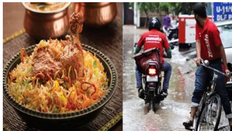
6 డెలివరీలు చేస్తుంటారు. అయితే వర్షం మొదలైన తర్వాత ఈ సంఖ్య ఏకంగా 12కి చేరడం విశేషం. ఉదయం, మధ్యాహ్నం, రాత్రి సమయాల్లో ఆర్డర్లు భారీగా పెరిగినట్లు డెలివరీ బాయ్స్ చెబుతున్నారు.

ఇయ్యాలి న్యూస్, హైదరాబాద్, జూలై 21: హైదరాబాద్ లో గడిచిన నాలుగు రోజులుగా భారీ వర్షం కురుస్తోన్న విషయం తెలిసిందే. సూర్యుడు కనిపించక చాలా రోజులవుతోంది. రాత్రి, పగలు అనే తేడా లేకుండా వర్షం కురుస్తూనే ఉంది. దీంతో ప్రజలంగా ఇంటికి పరిమితం అవుతున్నారు. అత్యవసరమైతే తప్ప ఆరుగురు బయటకు వెళ్లడం లేదు. ఇక విద్యా సంస్థలతో పాటు పలు ప్రభుత్వ సంస్థలకు సైతం సెలవులు ప్రకటించడంతో అంతా ఇళ్లకే పరిమితం అయ్యారు. ఇంతేమంది ఓవైపు చలి వణికిస్తుంటే మరోవైపు వేడి వేడిగా బిర్యానీలను లాగించేస్తున్నారు ప్రజలు. ఇంట్లో కూర్చోని ఎంచక్కా ఆన్ లైన్ లో ఆర్డర్ పెట్టుకుంటున్నారు. గడిచిన రెండు, మూడు రోజుల్లో భారీగా ఆర్డర్ దీనికి ప్రత్యక్ష సాక్షుంగా చెబుతున్నారు. వర్షాలు మొదలైన తర్వాత స్కిన్, జోమాలోతో పాటు పలు ఇన్ లైన్ డెలివరీ ఏజెన్సీలకు రోజులో ఏకంగా 1.30 లక్షల ఆర్డర్లు పెరిగినట్లు నివేదికలు చెబుతున్నాయి. ఒక్కసారిగా ఆర్డర్లు పెరగడంతో డెలివరీ బాయ్స్ ఆర్డర్లను అందుకోలేక ఇబ్బంది పడుతున్నారు. ప్రస్తుతం హైదరాబాద్ వ్యాప్తంగా మొత్తం 32 వేల మంది డెలివరీ బాయ్స్ ఉన్నారు. సాధారణంగా వీరు రోజులో కనీసం