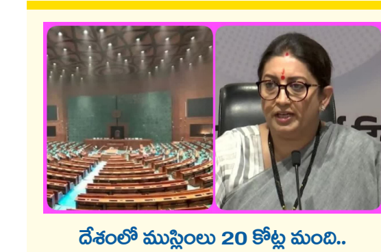
దేశంలో ముస్లింలు 20 కోట్ల మంది.. ప్రకటించిన కేంద్రం

ఇయ్యాలి న్యూస్, హైదరాబాద్, జూలై 21: వచ్చే ఏడాది పార్లమెంటు ఎన్నికలు జరగబోతున్నాయి. మరోవైపు డీఆర్ ఎస్ ను బీఆర్ఎస్ గా మార్చి జాతీయ స్థాయిలో రాజకీయాలు చేసేందుకు తెలంగాణ ముఖ్యమంత్రి కేసీఆర్ పక్కా ప్రణాళికతో ముందుకు సాగుతున్నారు. ఇప్పటికే తెలంగాణను దాటి మహారాష్ట్రలో కేసీఆర్ దూకుడు పెంచారు. మహా రాష్ట్రంలో ఇప్పటికే పలు భారీ బహిరంగసభలను నిర్వహించారు. ఆ రాష్ట్రానికి చెందిన పలువురు నేతలు, కార్యకర్తలు బీఆర్ఎస్ లో చేరారు. ఇంకొకవైపు పార్లమెంటు ఎన్నికల్లో మహారాష్ట్ర నుంచి పోటీ చేయాలని కేసీఆర్ భావిస్తున్నారని చెబుతున్నారు. నాందేడ్ లేదా ఔరంగాబాద్ నుంచి పోటీ చేయాలనుకుంటున్నారని సమాచారం. మహారాష్ట్ర నుంచి పోటీ చేస్తే జాతీయ స్థాయిలో పార్టీ బలోపేతవచ్చుతుందని ఆయన భావిస్తున్నారని తెలుస్తోంది.