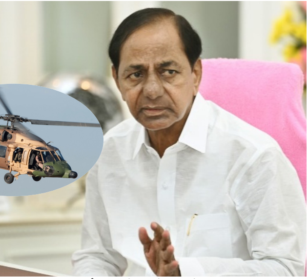
సీఎం ఆదేశాల నేపథ్యంలో సికింద్రాబాద్ కంట్రిస్టేషన్లో మిలిటరీ అధికారులతో బీఫ్ సెక్రటరీ సంప్రదింపులు జరిపి హెలికాప్టర్లను పంపించారు.

ఇయ్యాలి స్టూన్స్, హైదరాబాద్, జూలై 27: ఎడతెరిపి లేని వర్షాలతో తెలంగాణలోని నదులు, వాగులు, వంకలు పొంగిపోతున్నాయి. పరదల కారణంగా పలు ప్రాంతాల నీటి మునిగాయి. జయశంకర్ భూపాలపల్లి జిల్లాలోని మోరంచపల్లి గ్రామం జలదిగ్భయమయింది. మరోవైపు ప్రగతి భవన్ లో పరదలపై ముఖ్యమంత్రి కేసీఆర్ సమీక్ష నిర్వహిస్తున్నారు. పరదల పరిస్థితిని బీఫ్ సెక్రటరీ శాంతికుమారి ముఖ్యమంత్రికి వివరిస్తున్నారు. ఈ సందర్భంగా మోరంచపల్లిలో లెక్కవన్న ప్రజలను రక్షించేందుకు హెలికాప్టర్ ను పంపించాలని సీఎస్ ను ముఖ్యమంత్రి ఆదేశించారు.