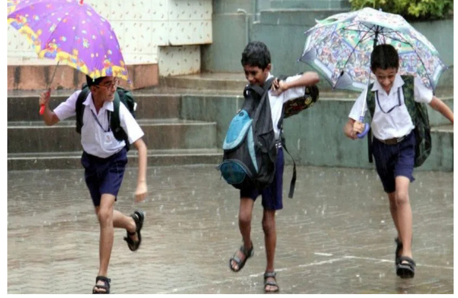
ప్రవహిస్తున్నాయి. రహదారులపై నీరుచేరి రాకపోకలకు తీవ్ర అంతరాయం ఏర్పడుతుంది. హైదరాబాద్ సహజ చాలా చోట్ల భారీ నుంచి అతి భారీ వర్షాలు పడుతున్నాయి. భారీ వర్షాల దెబ్బకు జనం బెంబేలైపోతున్నారు. ఇంట్లో నుంచి బయటకు వచ్చే పరిస్థితి కూడా లేకుండా పోయింది. వర్షాల కారణంగా ఇప్పటికే పట్టకపోవడంతో పాటు, శుక్రవారంనైతే భారీ వర్షాలు కురిసే అవకాశం ఉందని వాతావరణ శాఖ హెచ్చరికలు జారీ చేసింది. ఈ క్రమంలో తెలంగాణలోని విద్యా సంస్థలకు ప్రభుత్వం రేపు (శుక్రవారం) కూడా సెలవు ప్రకటించింది. భారీ, అతి భారీ వర్షాల కురుస్తున్న నేపథ్యంలో ఈ సెలవు ప్రకటించినట్లు తెలిసింది.

ఇయ్యాలి స్టూన్స్, హైదరాబాద్, జూలై 27: తెలంగాణ రెండు రోజులు పాటు విద్యాసంస్థలకు తెలంగాణ వ్యాప్తంగా ఎడతెరిపి లేకుండా భారీ వర్షాలు కురుస్తున్నాయి. దీంతో వాగులు, వంకలు పొంగి