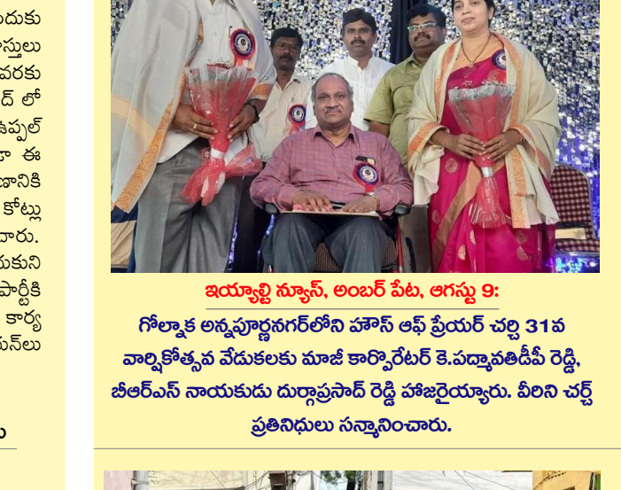
హజ్రత్ క్రీస్టియన్ సోదరులు

శాతం సబ్సిడీతో రూ. ఒక లక్ష ఆర్థిక సాయం అందించేందుకు తెలంగాణ రాష్ట్ర క్రీస్టియన్ కార్పొరేషన్ ఈ నెల 31 నుంచి దరఖాస్తులు స్వీకరించనున్నట్లు తెలిపారు. ఈ నెల 31 నుంచి ఆగస్టు 14 వరకు దరఖాస్తులు స్వీకరిస్తారని తెలిపారు. రాష్ట్రం సదీబొద్దున్ హైదరాబాద్ లో క్రీస్టియన్లు ఆత్మగౌరవం భవనం ఉండాలని తలచిన కేసీఆర్ ఉమ్మల్ భగాయత్ లో 2 ఎకరాలు స్థలం కేటాయించారు. అంతేకాకుండా ఈ స్థలంలో క్రీస్టియన్ భవన నిర్మాణానికి ప్రభుత్వం తొలుత రూ. 10 కోట్లు కేటాయింబించింది వివరించారు. కేసీఆర్ చేస్తున్న సేవలు గుర్తుంచుకుని క్రీస్టియన్ల సమాజం బీఆర్ఎస్ పార్టీకి అండగా ఉంటుందన్నారు. ఈ కార్యక్రమంలో పెద్ద సంఖ్యలో క్రీస్టియన్లు పాల్గొన్నారు