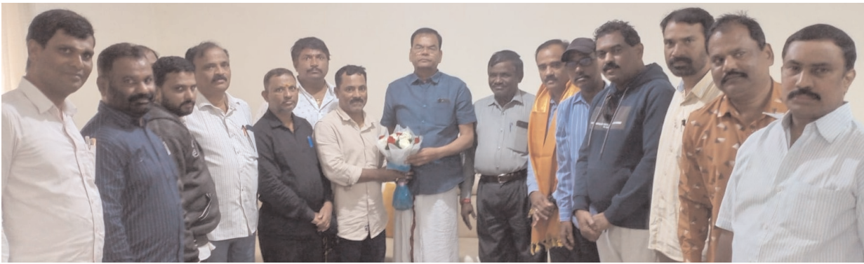
ఎమ్మెల్యే కాలేరుకు శుభాకాంక్షలు తెలుపుతున్న నియోజకవర్గ జర్నలిస్టులు

ఇయ్యాలి న్యూస్, అంబర్ పేట, డిసెంబర్ 05: భారీ మెజార్స్ రెండో సారి అంబర్ పేట గడ్డపై గులాబీ జెండా ఎగుర వేసిన ఎమ్మెల్యే కాలేరు వెంటకే కు మూడో రోజు శుభాకాంక్షల వెల్లువ కొనసాగుతోంది. మంగళవారం అంబర్ పేట నియోజకవర్గానికి చెందిన వివిధ ప్రధాన