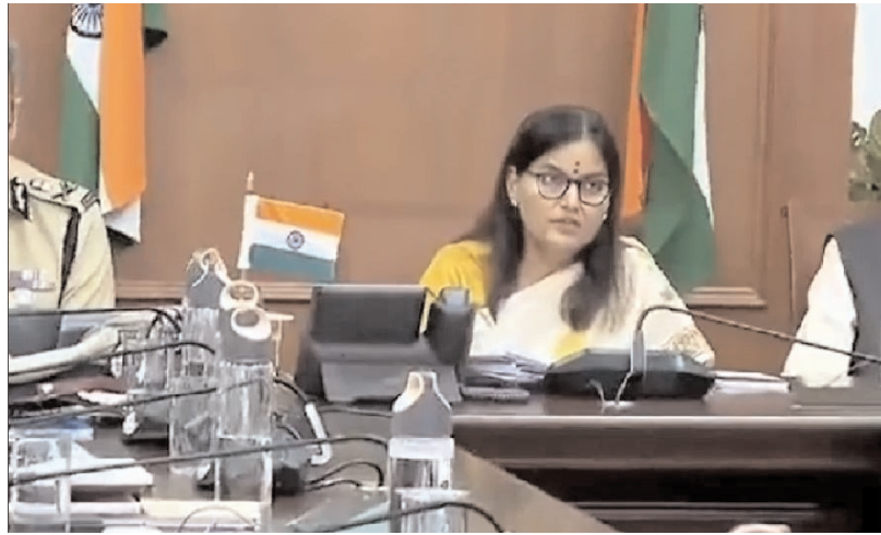
చెరువులకు గండ్లు పడకుండా చూడాలన్నారు. జిల్లాలకు ఎన్టీఆర్ఎఫ్ బృందాలను పంపిస్తున్నట్లు తెలిపారు. ప్రజలను సురక్షిత ప్రాంతాలకు తరలించాలని కలెక్టర్లకు సూచించారు. భద్రాద్రి, ములుగు

ఇయ్యాలి న్యూస్, హైదరాబాద్, డిసెంబర్ 05: మిగ్నామ్ తుపాను ప్రభావంతో రాగల రెండురోజుల పాటు భారీ నుంచి అతి భారీ వర్షాలు కురుస్తాయని హైదరాబాద్ వాతావరణ కేంద్రం తెలిపింది. వరంగల్వారం నుంచి బుధవారం ఉదయం వరకు ములుగు, భద్రాద్రి కొత్తగూడెం, ఖమ్మం జిల్లాల్లో అత్యంత భారీ వర్షాలు కురిసే అవకాశం ఉందని హెచ్చరించింది. ఈ మేరకు రెడ్ అలెర్ట్ ను జారీ చేసింది. సూర్యాపేట, మహబూబాబాద్, వరంగల్ జిల్లాల్లో అతి భారీ వర్షాలు కురుస్తాయని తెలిపింది. మిగ్నామ్ తుపాను కారణంగా తెలంగాణ జిల్లాల్లో ఎడతెరిపిలేని వర్షాల నేపథ్యంలో ఆయా జిల్లాల కలెక్టర్లతో సీఎస్ శాంతికుమారి టెలికాన్ఫరెన్స్ నిర్వహించారు. కలెక్టర్లను, అధికారులను అప్రమత్తం చేశారు. వర్షాలు పడే అవకాశమున్నందున అప్రమత్తంగా ఉండాలని సూచించారు. పూర్తిగా నిండిన