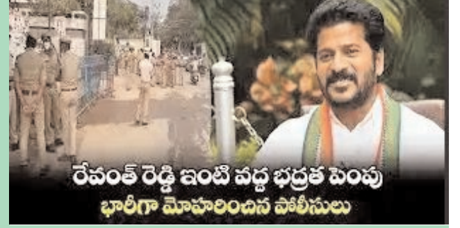
రేవంత్ రెడ్డి ఇంటి వద్ద భద్రత పెంపు భారీగా మోహరించిన పోలీసులు

సీఎం ఎవరనే దానిపై పార్టీలో సస్పెన్స్ కొనసాగుతోంది. వెజాల్కి ఎమ్మెల్యేలు.. సీఎంగా రేవంత్ =ం డ్డం స క్ రుకుంటున్నట్లు తెలుస్తోంది. రేవంత్ పాటు భక్తి విక్రమార్కు ఉత్తమ్ కుమార్ రెడ్డిలు కూడా సీఎం రేనులో ఉండడంతో సీఎం ఎంపిక అలస్యమవుతోంది. అయితే, కాంగ్రెస్ అధిష్టానం