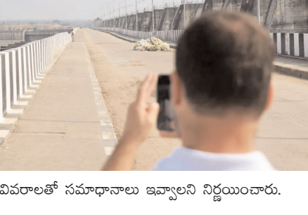
వివరాలతో సమాధానాలు ఇవ్వాలని నిర్ణయించారు.