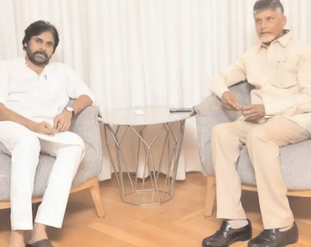
ఈ సమావేశం రెండున్నర గంటలపాటు జరిగింది. పాతు నేపథ్యంలో ఉమ్మడి మేనిఫెస్టో కోసం షణ్ముఖ వ్యూహం పేరుతో పవన్ 6 లంకాలను ప్రతిపాదించారు.