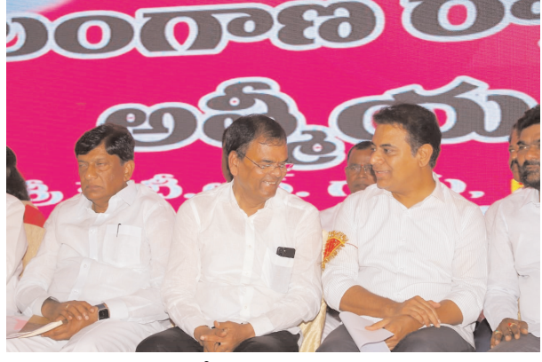
అడ్వోకేట్ల సమ్మేళనంలో కేటీఆర్ తో కాలేరు మాట్లాడుతుంది

అడ్వోకేట్ ట్రస్టుకు రూ.500 కోట్లకు పెంపు న్యాయవాదుల సమ్మేళనంలో కేటీఆర్