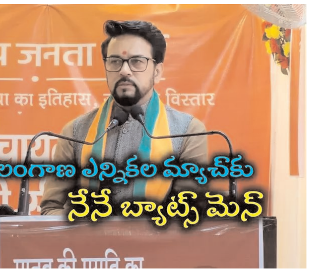
తెలంగాణ ఎన్నికల మ్యాచ్ కు నేనే బ్యాట్స్ మెన్

ప్రతి ఒక్కరి నెంబర్ వస్తుంది.. వాళ్లు కూడా జైలుకు వెళ్లక తప్పదంటూ కీలక వ్యాఖ్యలు చేశారు. అయితే.. ధిల్లీ లిక్కర్ స్కాం కేసులో కవిత పేరు ఉందని.. ఆమె నెంబర్ కూడా త్వరలోనే వస్తుందని చెప్పుకొచ్చారు. తెలంగాణలో ఎంత తిన్నా సరిపోలేదని కేసీఆర్.. తన కూతురిని ధిల్లీకి పంపి లిక్కర్ స్కాం చేపించారంటూ విమర్శలు గుప్పించారు. లిక్కర్ స్కాం కేసులో ధిల్లీ ఉప ముఖ్యమంత్రి ఇప్పటికే జైల్లో ఉన్నారని.. సీఎం అరవింద్ కె.జైవాలకు కూడా నోటీసులు అందాయని వివరించారు అనురాగ్ ఠాకూర్.