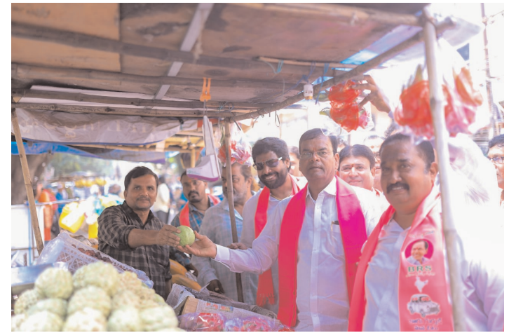
కూరగాయల మార్కెట్ లో జామ కాయ కొంటూ ఓటు అడుగుతున్న కాలేరు