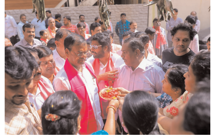
నల్లకుంట విజిటివల్ మార్కెట్ బస్ట్లో కాలేరుతో పోలికలతో స్వాగతం పలుకుతున్న మహిళలు