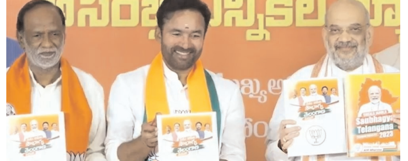
లక్షణ్, కిషన్ రెడ్డితో కలిసి బీజేపీ మేనిఫెస్టో లిజిట్ చేస్తున్న అమిత్ షా

చేసిన బీజేపీ మేనిఫెస్టోలో ముఖ్యంశాలు... 1. ప్రజలందరికీ సుపరిపాలన - సమర్థవంతమైన పాలన - అవినీతిని ఉక్కుపాదంతో అణచివేయడం - ప్రధాని మోదీ ఆలోచనలకు అనుగుణంగా సబ్ కా పాథ్ - సబ్ కా వికాస్, సబ్ కా విశ్వాస్, సబ్ కా ప్రయాగ్ నివాసంతో సుపరిపాలన 2. బీజేపీ పాలన కాలాల్లో ఉన్నట్లుగా పెట్రోల్, డీజిల్ ధరలపై వ్యాజ్ ను తగ్గించి పెట్రో ఉత్పత్తుల ధరల తగ్గింపు 3. కారు, గురు - అహార భద్రత, నివాసం 4. రైతే రాజు - అన్నదాతలకు అందం. విత్తనాల కొనుగోలుకు రూ.2500 ఇన్పుట్ అన్నిసార్లు 5. నారి శక్తి - మహిళల నేతృత్వంలో అభివృద్ధి, మహిళా రైతుల కోసం మహిళా రైతు కార్పొరేషన్, మహిళలకు 10 లక్షల వరకు ఉద్యోగాలు 6. యువ శక్తి - యూపీఎస్ తరహాలో గ్రూప్ 1, గ్రూప్ 2 నిర్వహణ. ఈడబ్ల్యుఎస్ కోటాలో సహా