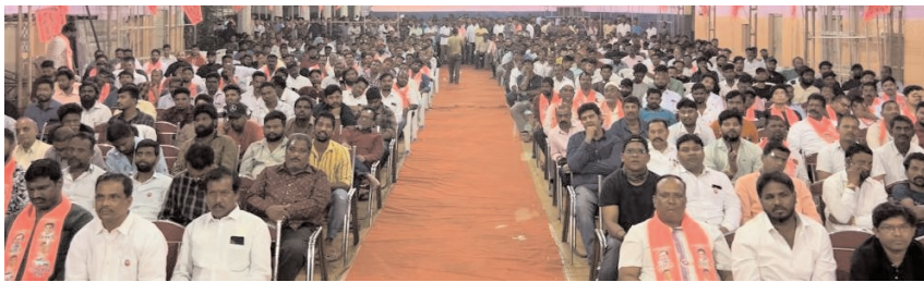
పెద్ద ఎత్తున హాజరైన గులాబీ యువ దండం