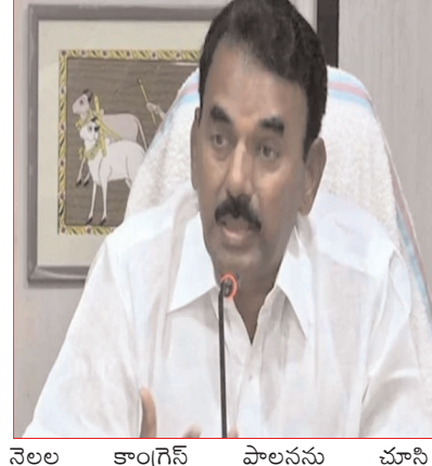
నెలల కాంగ్రెస్ పాలనను చూసి

ఇయ్యాలి న్యూస్, హైదరాబాద్, ఏప్రిల్ 6: బీఆర్ఎస్ అధినేత, మాజీ సీఎం కేసీఆర్ పై మంత్రి జూపల్లి కృష్ణారావు ఘాటు విమర్శలు చేశారు. శనివారం ఆయన మంత్రులు ఉత్తమ కుమార్ రెడ్డి, పొన్నం ప్రభాకర్ తో కలిసి గాంధీభవన్లో మీడియాతో మాట్లాడుతూ.. కేసీఆర్ చవట, దర్దమ్ము కాకపోతే ధనిక రాష్ట్రాన్ని రూ. 8 లక్షల కోట్ల అప్పుల్లోకి నెట్టారని ధ్వజమెత్తారు. ప్రాంతీయుడు తన ప్రాంతానికి అన్యాయం చేస్తే అదే ప్రాంతంలోనే పాతి పెట్టాలనే సామెత ప్రకారం కేసీఆర్ ను పాతి పెట్టాలన్నారు. తన పదేళ్ల పాలనలో ఎప్పుడైనా కేసీఆర్ పంట నష్టం ఇచ్చారా అని మంత్రి మండిపడ్డారు. ఫామ్ హౌస్ లో ఉండి ప్రభుత్వాన్ని నడిపిన కేసీఆర్.. ఇప్పుడు నాలుగు