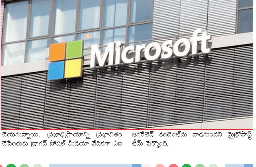
చేయనున్నాయి. ప్రజాభిప్రాయాన్ని ప్రభావితం జనరేటివ్ కంటెంట్ ను వాడనుందని మైక్రోసాఫ్ట్ చేసేందుకు డ్రాగన్ సోఫట్ మీడియా వేదికగా ఏబి టీవీ పేర్కొంది.

ఇయ్యలీ న్యూస్, వెబ్ డెస్క్, ఏప్రిల్ 6: భారత్ లో సార్వత్రిక ఎన్నికల వేళ మైక్రోసాఫ్ట్ కిలక ప్రకటన చేసింది. ఎన్నికల్లో చైనా అవాంతరాలు సృష్టించే అవకాశం ఉందని హెచ్చరించింది. భారత్ సహా అమెరికా, దక్షిణ దక్షిణ ఆసియా ఎన్నికల ప్రక్రియలో కూడా జోక్యం చేసుకునేందుకు ప్లాన్ చేస్తోందని పేర్కొంది. ఇందుకోసం కృత్రిమ మేధస్సు అప్రంగా చేసుకోవడం ద్వారా టెక్ దిగ్గజం మైక్రోసాఫ్ట్ తెలిపింది. ప్రజాస్వామ్యానికి జీవనాదులుగా భావించే ఎన్నికలకు ప్రపంచవ్యాప్తంగా పలు దేశాలు సిద్ధమవుతున్నాయి. దాదాపు 64 దేశాల్లో ఈ ఏడాది కొత్తగా ప్రభుత్వాలు కొలువుదీరుతున్నాయి. ఈ నేపథ్యంలో మైక్రోసాఫ్ట్ ఈ హెచ్చరిక చేసింది. మైక్రోసాఫ్ట్ డ్రైట్ ఇంటెలిజెన్స్ టీమ్ ప్రకారం.. చైనా ప్రభుత్వ మద్దతు ఉన్న సైబర్ గ్రూపులు ఈ ఏడాది జరిగనున్న పలు దేశాల ఎన్నికలను ప్రభావితం