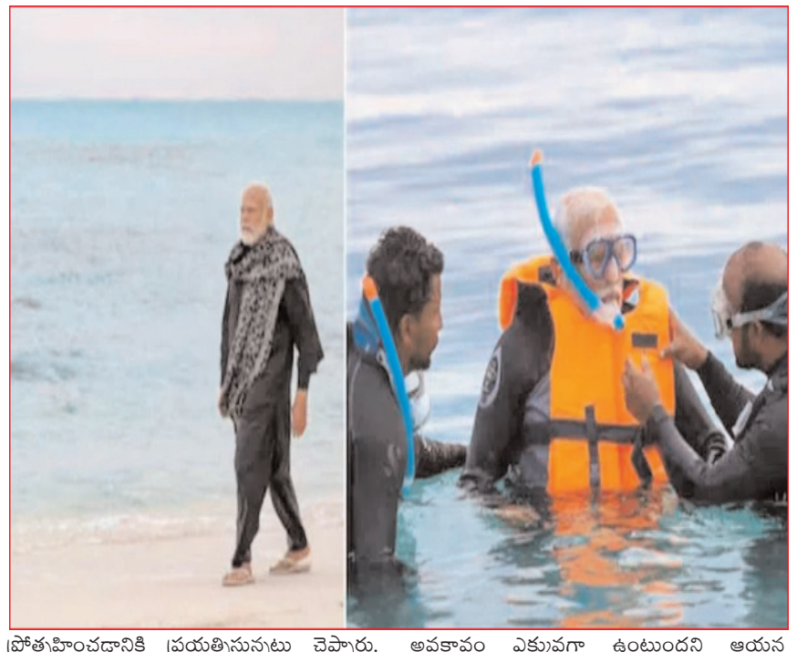
ప్రోత్సహించడానికి ప్రయత్నిస్తున్నట్లు చెప్పారు. అవకాశం ఎక్కువగా ఉంటుందని ఆయన అడవిధంగా ఎయిర్ కెక్టివిటీని అభివృద్ధి చేశారు. క్రమబద్ధీకరణం వల్ల పర్యాటకులను ఆకర్షించే

ఇయ్యలీ న్యూస్, వెబ్ డెస్క్, ఏప్రిల్ 6: కేంద్రపాలిత ప్రాంతమైన లక్షదీప్తి పర్యాటకానికి కొత్త రెక్కలు వచ్చాయి. ప్రధాన మంత్రి నరేంద్ర మోదీ పర్యటన తర్వాత ఈ ప్రాంతానికి వచ్చేందుకు పర్యాటకులు ఆసక్తి చూపుతున్నారు. ప్రస్తుతం లక్షదీప్తి దీవులను సందర్శించే వారి సంఖ్య గతంలో కంటే భారీగా పెరిగినట్లు అక్కడి పర్యాటక శాఖ అధికారులు తాజాగా వెల్లడించారు. ప్రధాన మంత్రి నరేంద్ర మోదీ దేశంలో ప్రభావవంతమైన నాయకుడు. డిసెంబర్ 2023లో లక్షదీప్తి దీవులను మోదీ సందర్శించారు. ఆయన పర్యటనతో లక్షదీప్తి పర్యాటకుల సంఖ్య పెరిగింది. అంతర్జాతీయ, విదేశీ పర్యాటకులు ఈ ద్వీపాన్ని సందర్శించడానికి స్వాకేళన కోసం మమ్మల్ని సంప్రదిస్తున్నారు. ప్యాకేజీల గురించి మరింత తెలుసుకునేందుకు ప్రజలు చాలా ఆసక్తి చూపుతున్నారు. ఆన్ లైన్ లో పెద్ద ఎత్తున సెన్స్ చేస్తున్నారు అని అక్కడి పర్యాటక శాఖ అధికారి ఇంతియాజ్ మహ్మద్ తెలిపారు. మరోవైపు లక్షదీప్తిలో వివిధ పర్యాటక కార్యకలాపాలను క్రమబద్ధీకరిస్తున్నట్లు ఆయన తెలిపారు. న్యూ డెవింగ్, వాటర్ స్కోప్ లక్షదీప్తి టూరిజంలో ప్రధాన ఆదాయాన్ని అందించే విభాగాలని ఇంతియాజ్ వెల్లడించారు. భవిష్యత్తులో లక్షదీప్తి మరన్ని క్రూయిజ్ షిప్ కంపెనీలను