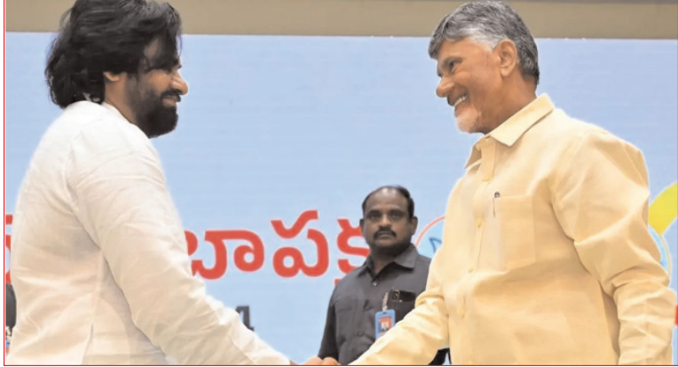
శాఖలు కేటాయింపు ఇలా..