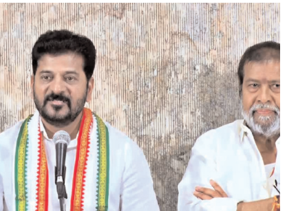
కాంగ్రెస్ ఎంపీలు కేంద్రానికి నిరసన తెలుపుతారని స్పష్టం చేశారు.

ఇయ్యాలి న్యూస్, హైదరాబాద్, జూలై 23: కేంద్ర బడ్జెట్లో రాష్ట్ర ప్రస్తావన లేకపోవడంపై ముఖ్యమంత్రి రేవంత్ రెడ్డి తీవ్ర స్థాయిలో ధ్వజమెత్తారు. రాష్ట్ర ఏర్పాటును అవమానించిన ప్రధాని మోడీ మొదటి నుంచి రాష్ట్రంపై కక్ష చూపుతున్నారని మండిపడ్డారు. రాష్ట్ర మంత్రులతో కలిసి ఇప్పటికే 18 సార్లు కేంద్రాన్ని కలిసి విజ్ఞప్తి చేసినా, రాష్ట్రానికి అన్యాయమే చేశారని విమర్శించారు. రాష్ట్ర ప్రజలు నిర్ణయం వల్లే మోడీ ప్రధాని అయ్యారన్న సీఎం, 35 శాతం ఓట్లు, 8 సీట్లైన ప్రజల పట్ల కృతజ్ఞత చూపించలేదని యుద్ధబట్టారు. రాష్ట్ర హక్కులపై రేపు అసెంబ్లీలో చర్చించి తీర్మానం చేస్తామని ముఖ్యమంత్రి రేవంత్ రెడ్డి స్పష్టం చేశారు. 8 మంది