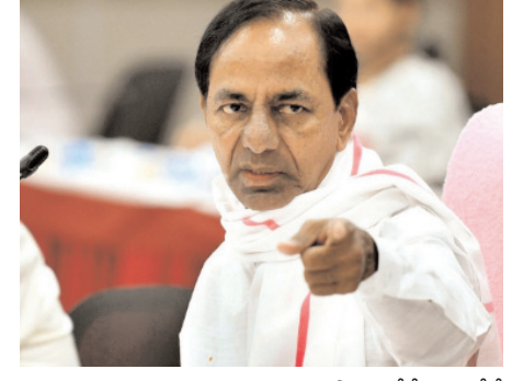
పెట్టుకుండా గత ప్రభుత్వాన్ని అభానుపాలు చేసే వనిలోనే ఉన్నారని మరగలమందించారు. మొన్నటి వరకు ప్రశాంతంగా ఉన్న తెలంగాణలో శాంతిభద్రతలు ఎందుకు తప్పుకాయని నిలదీశారు. ఎక్కడో ఉన్న వారిని చేరదీసి మంచి నేతలను చేసే పదవులు ఇస్తే.. వాళ్లు మాత్రం పదవులు అనుభవించి పార్టీ వీరుతున్నారని ఆగ్రహం వ్యక్తం చేశారు. పార్టీ వదిలి వెళ్లే వారి గురించి ఆలోచించాల్సిన అవసరం లేదని కేసీఆర్ పార్టీ శ్రేణులకు తెల్పి చెప్పారు.

ఇయ్యాలి న్యూస్, హైదరాబాద్, జూలై 23: బీఆర్ఎస్ ఎమ్మెల్యే, కాతురు కవిత అరెస్టుపై మాజీ సీఎం కేసీఆర్ తలసంచలన వ్యాఖ్యలు చేశారు. తెలంగాణ భవన్లో మంగళవారం జరిగిన బీఆర్ఎస్ ఎన్ని మీటింగ్లో ఆయన మాట్లాడుతూ.. రాజకీయ కక్షతోనే నా కూమారైన జైల్లో పెట్టారని ఆరోపించారు. సొంత బిడ్డ జైల్లో ఉంటే కన్నీ తండ్రిగా నాకు బాధగా ఉందా.. ప్రస్తుతం నేను సలసల మరగిపోయే అగ్ని పర్వతంలా ఉన్నారని కేసీఆర్ ఆసక్తికర వ్యాఖ్యలు చేశారు. ఇక, ఎమ్మెల్యేలు వరుసగా పార్టీ వీరటంకా బీఆర్ఎస్ క్షిప్త పరిస్థితుల్లో ఉండన్న వ్యాఖ్యలకు సైతం గులాబీ బాస్ కౌంటర్ ఇచ్చారు. బీఆర్ఎస్ పార్టీ క్షిప్త పరిస్థితులు ఏమీ లేవని, ఇంతకంటే ఇబ్బందికర పరిస్థితుల్లోనే ప్రత్యేక తెలంగాణ రాష్ట్రం సాధించామని ఈ సందర్భంగా గుర్తు చేశారు. మొన్నటి వరకు నలుగురు ఎమ్మెల్యేలే ఉన్న కాంగ్రెస్ అధికారంలోకి రాతే అని తిరిగి ప్రస్తావించారు. అధికారంలో కంటే అరాజకవనోలో ఉన్నప్పుడే ఎమ్మెల్యేలు బాగా ఎదుగుతారని అభిప్రాయం వ్యక్తం చేశారు. అధికారంలోకి వచ్చి ఏడు నెలలైనా కాంగ్రెస్ పాలనపై పట్టు సాధించలేకపోయారన్నారు. పాలనపై దృష్టి