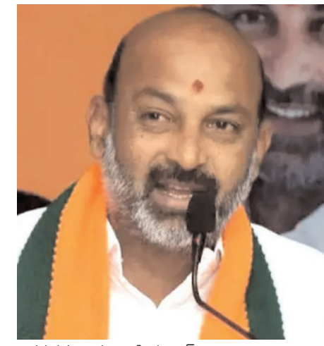
నిరర్థనమన్నారు బండి సంజయ్.