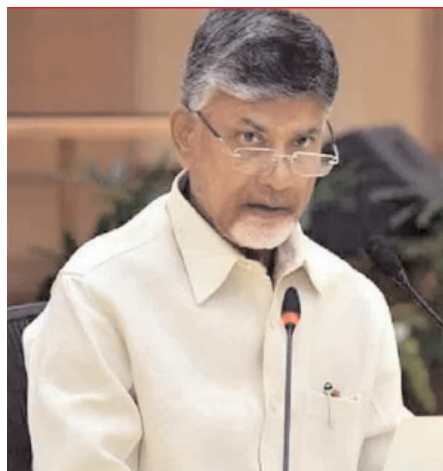
ఇయ్యాలి న్యూస్, ఏపీ, జూలై 23: కేంద్రం మంగళవారం

ప్రవేశపెట్టిన బడ్జెట్లో ఆంధ్రప్రదేశ్కు ప్రాధాన్యం ఇవ్వడం పట్ల ముఖ్యమంత్రి చంద్రబాబు నాయుడు హర్షం ప్రకటించారు. ఈ సందర్భంగా ఎక్స్ వేదికగా నిర్వహించిన ప్రధాని నరేంద్ర మోదీ, కేంద్ర ఆర్థిక మంత్రి నిర్మలా సీతారామన్లకు ధన్యవాదాలు తెలిపారు. రాష్ట్ర అవసరాలను గుర్తించి 2024-25 ఆర్థిక సంవత్సరానికిగాను సాధారణ బడ్జెట్ లో రాజధాని అమరావతి, పోలవరం, పారిశ్రామిక రంగాలతో పాటు వెనుకబడ్డ ప్రాంతాల అభివృద్ధిపై దృష్టి సారించినందుకు ఏపీ ప్రజల తరుపున ధన్యవాదాలు తెలిపారు. కేంద్రం అందించిన ఈ తోడ్పాటు ఏపీ భవిష్యత్ పునర్నిర్మాణానికి ఎంతగానో ఉపయోగ పడుతుందని పేర్కొన్నారు. ఈ ప్రగతిని, విశ్వాసాన్ని పెంచే ఈ బడ్జెట్ సమర్పించినందుకు నేను మిమ్మల్ని అభినందిస్తున్నానని పేర్కొన్నారు.