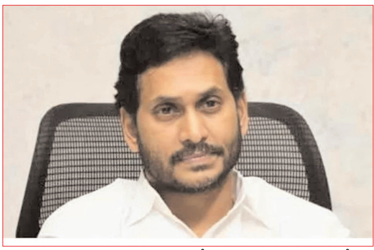
సాంప్రదాయాలను పాటించడం లేదని, తనకు ప్రతిపక్ష నేతగా

ఇయ్యాలి న్యూస్, ఏపీ, జూలై 23: వైఎస్సార్సీపీ అధినేత, మాజీ సీఎం వైఎస్ జగన్ ఏపీ హైకోర్టును ఆశ్రయించారు. ఏపీ అసెంబ్లీ లో తనకు ప్రతిపక్ష నేత హోదా ఇవ్వాలని స్పీకర్ను ఆడించాలని మంగళవారం పిటిషన్ దాఖలు చేశారు. సభలో ప్రతిపక్షంలో ఎవరు ఎక్కువ సభ్యులు ఉంటే వారికి ప్రతిపక్ష హోదా ఉంటుందని సూచిస్తూనే తనకు ప్రతిపక్ష నేత హోదా ఇవ్వాలని కోరారు. ఏపీ శాసనసభలో పార్లమెంటరీ