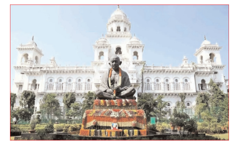
సమావేశంలో.. ఈ నెల 31 వరకు తెలంగాణ అసెంబ్లీ సమావేశాలు జరగనున్నాయి. ఇక తెలంగాణ అసెంబ్లీ సమావేశాలు 8 రోజుల పాటు జరగనున్నాయి. నేడు అసెంబ్లీలో రైతు రుణమాఫీపై చర్చ జరగనుంది. ఆ మరుసటి రోజు గురువారం డిప్యూటీ సీఎం భద్రాజు విక్రమార్కు బడ్జెట్ ప్రవేశ పెట్టనున్నారు.