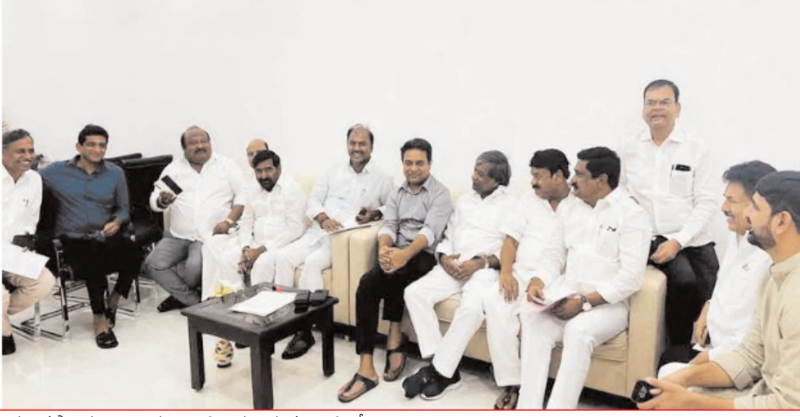
జూపల్లి కృష్ణారావు అని వార్తలు వినిపించిన సంగతి తెలిసిందే.