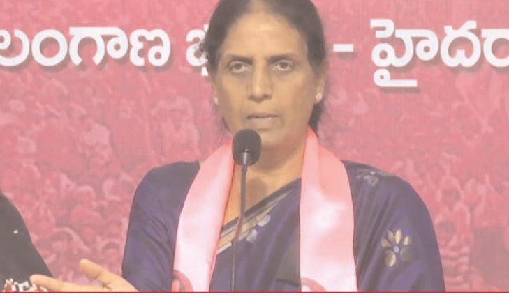
మహిళలకు అవకాశం తెలిపేవారు. సభలో 9 మంది మహిళా సభ్యులు.. మాట్లాడే

అవకాశమే రావట్లేదు. ఎస్సీ వర్గీకరణపై మాట్లాడుదామనుకుంటే మైక్ ఇవ్వలేదు. పార్టీ మారటం పెద్ద నేరమైతే.. ఇప్పుడు కాంగ్రెస్ లోకి తెరాస ఎమ్మెల్యేలు రాలేదా? రాహుల్ గాంధీ మిమ్మల్ని నమ్మితే మీరు ఆయన బతుకు సికింద్రాబాద్ రైల్వే స్టేషన్ చేస్తారు? నా వల్లే సీఎంపై పదవి పోయిందని డిప్యూటీ సీఎం భట్టి విక్రమార్కు అన్నారు. ఇప్పుడు ఎస్సీ నేతకు సీఎం పదవి ఇచ్చారు అయిన ఎందుకు ఆడగరేదు? సభలో లేని ఎమ్మెల్యే కవిత గురించి ఎందుకు ప్రస్తావించాలి? ఆడబిడ్డ అయితే.. శత్రువు కుమార్తె అయినా జాలి చూపే సమాజం మనది. మమ్మల్ని అవమానించిన తీరును రాష్ట్రమంతా గమనించింది. రాష్ట్రంలో, హైదరాబాద్ లో మహిళలకు భద్రత కరువైంది" అని సబిత అన్నారు.