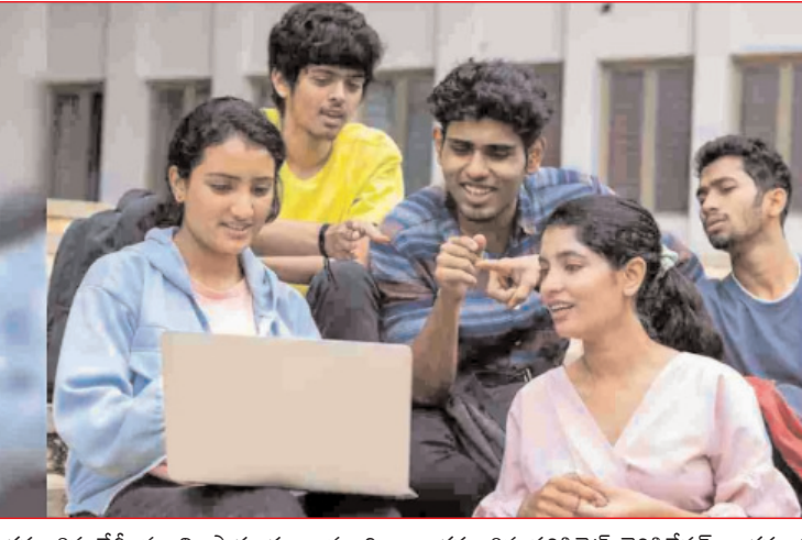
ఆగస్టు 8వ తేదీ నుంచి ప్రారంభం కానుంది. ఆగస్టు 9న నర్సికెట్ వెంకీశేషన్, ఆగస్టు 9,

10 తేదీల్లో వెట్ ఆఫ్ఫీస్ నమోదు, ఆగస్టు 13వ తేదీన మూడో విడత సీట్ల కేటాయింపు ఉంటుంది. ఆగస్టు 10 న వెట్ ఆఫ్ఫీస్ ఫ్రీజింగ్ ఉంటుంది. ఆగస్టు 13 తాత్కాలికంగా సీట్ల కేటాయింపు ఉంటుంది. ఇక అదే రోజు సెల్ఫ్ రిపోర్టింగ్ కూడా చేయాల్సి ఉంటుంది. ఆగస్టు 13 నుంచి 15 వరకు టూర్నాఫ్ ఫీజు చెల్లింపు, వెట్ సైట్ ద్వారా స్వయంగా రిపోర్టింగ్ చేయాలి. ఆగస్టు 16 నుంచి 17 వరకు కాలేజీల్లో రిపోర్టింగ్ చేయాలి. ఆగస్టు 17న కాలేజీల వారిగా సీట్లు పొందిన విద్యార్థుల వివరాలు ప్రకటిస్తారు. కాగా రాష్ట్రంలోని 175 అందుబాటులో కాలేజీల్లో మొత్తం 86,509 సీట్లు అందుబాటులో ఉండగా.. రెండు విడతల కౌన్సెలింగ్ లలో 81,490 సీట్లు భర్తీ అయ్యాయి. ఇంకా 5019 సీట్లు అందుబాటులో ఉన్నాయి. మిగిలిపోయిన సీట్లకు తుది విడతలో సీట్లు కేటాయిస్తారు.