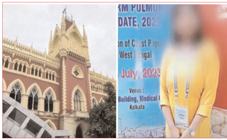
అధికారులు కప్పివచ్చే ప్రయత్నం చేసినట్లు ఆరోపణలు వచ్చాయి. అతి దారుణంగా చేసినట్లు.. ఆమె అత్యంత వేసకున్నట్లు తొలక తుటుంబంధ్యులకు ఫోన్

ఇయ్యలీ న్యూస్, క్రెం, ఆగస్టు 13: దేశవ్యాప్తంగా సంచలనం సృష్టించిన కోల్ కతా లేడీ దాకర్ రేవ్ అండ్ మర్డర్ కేసు దర్యాప్తును సీబీఐకి అప్పగిస్తూ కోల్ కతా హైకోర్టు కీలక ఆదేశాలు జారీ చేసింది. కేసు విచారణను మూడు వారాల పాటు హైకోర్టు వాయిదా వేసింది. ఈ కేసు విచారణకు ఆదివారం వరకు కోల్ కతా పోలీసులకు డెమాండ్ సీఎం ముఖతా జెనరల్ డెడ్లైన్ విధించారు. అయితే డీడీ డెడ్లైన్ కంటే ముందే హైకోర్టు కేసు విచారణను సీబీఐకి అప్పగించింది. కోల్ కతా ఆర్డర్ కల్ మెడికల్ ఆస్పత్రి ప్రెసిడెంట్ హైకోర్టు తీవ్ర ఆగ్రహం వ్యక్తం చేసింది. ప్రెసిడెంట్ నందీవ్ ఫోజ్ వేరే మెడికల్ కాలేజీ బదిలీ మీద పంచదం కాదు.. సెలవులపై వెళ్లాలని హైకోర్టు ఆదేశించింది. జూనియర్ దాకర్ హత్యను ఆస్పత్రి