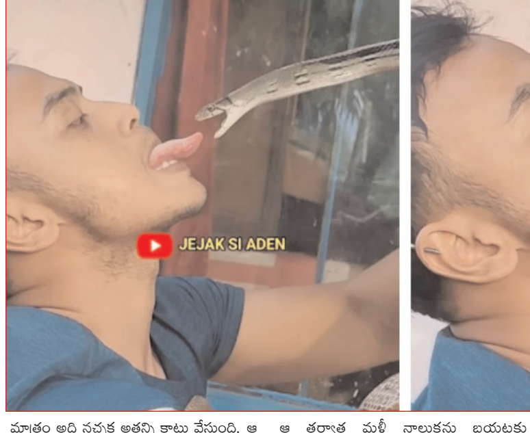
మాత్రం అది నచ్చక అతన్ని కొట్టాడు వేస్తుంది. ఆ తర్వాత మెల్లిగా పామును మచ్చిక చేసుకుంటూ.. పామును తన నైపుకు తిప్పుకున్నాడు. ఆ తర్వాత తన నాలుకను బయటకు చాపాడు. పాము నాలుకను టన్ ట్రెనింగ్ ఇస్తున్నట్లు ఉంది. పాముతో ఇంత

ఇయ్యలీ న్యూస్, వెబ్ డెస్క్, ఆగస్టు 13: సాధారణంగా పామును అమడ దూరంలో చూస్తేనే.. పరుగులు పెడతాం. పామును చూస్తేనే చాలా మందికి భయం. అదే విధంగా పామును దేవుడిగా కొలిచి పూజించే వాళ్లు కూడా ఎక్కువ మంది ఉన్నారు. ఇలా ఎవరి వెర్షన్ వాళ్లు. అయితే ఇంకొందరు మాత్రం పాముతో ఆటలు కూడా ఆడతారు. ఇంట్లో పాములను పెంచుకునే వాళ్లు కూడా చాలా మంది ఉన్నారు. సోషల్ మీడియాలో ఎక్కువగా పాములకు సంబంధించిన వీడియోలు చాలానే వైరల్ అవుతూ ఉంటాయి. పాములకు సంబంధించి ఎలాంటి వీడియోలు అయినా సరే క్షణాల్లో నెట్టింట్లో జోరుగా వైరల్ అవుతాయి. తాజాగా పాముకు సంబంధించిన మరో వీడియో కూడా ఇంటర్నెట్లో వైరల్ చేస్తుంది. పులి నోట్లో తల పెట్టడం అనే సామెత గురించి వినే ఉంటారు. కానీ ఇక్కడ ఈ అభ్యాసం పాము నోట్లో నాలుక పెట్టడం కాస్త విచిత్రంగా ఉంది. ఈ వీడియో చూస్తే.. ఒక అభ్యాసం పాముతో ఆడుతూ ఉంటారు. పాము విషపూరితమైన జీవి. ఒక్క కాటు వేస్తే చాలు.. నరాల్లోకి విషం ఎక్కి.. గంటల్లోనే ప్రాణాలు కోల్పోతారు. పాములో మరలించే విష పులితెనుసవి కూడా ఉంటాయి. ఈ వీడియోలో ఇతను పాము వెతుక్కోదాగా పట్టుకుని ఆడుతున్నాడు. కానీ పాము