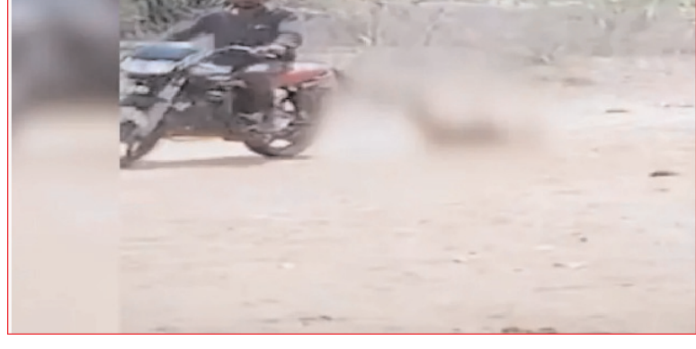
నివసించే ఓ నిరుపేద కుటుంబానికి చెందిన కుమార్తెను పెళ్లి చేసుకున్నాడు. ఇందుకోసం నిందితులు బాలిక తల్లిదండ్రులకు భారీ మొత్తంలో చెల్లించారు. వివాహసంతరం నిందితుడు తన భార్యను నగర్ లోని పూర్ కు తీసుకొచ్చి నివసించడం ప్రారంభించాడు. ఈ పెళ్లి తర్వాత ఇద్దరి మధ్య చాలా గొడవలు జరిగేవని ఇరుగుపొరుగు వారు చెబుతున్నారు.