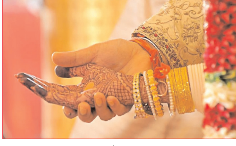
గ్రామానికి చెందిన బాలిక తన కుటుంబంతో కలిసి ఫుతంపూర్ లోని ఇటుక బిట్టిలో కూర్చుంటూ ప్రమాణం చేసుకున్నారు. కాగా.. జూలై 26న చెందిన యువకుడితో ఆమెకు ప్రేమ

ఇయ్యలీ న్యూస్, క్రెం, ఆగస్టు 13: యూపీలోని హమీర్ పూర్ లో ఓ దారుణ ఘటన వెలుగులోకి వచ్చింది. ఇంటి నుంచి పారిపోయి ప్రియుడి కోసం వస్తే.. ప్రియురాలిపై యువకుడి తండ్రి అఘాయిత్యానికి పాల్పడ్డారు. అంతకు ముందు.. ప్రియుడు, ప్రియురాలు వీరి పెళ్లి కోసం నకిలీ పత్రాలు తయారు చేసుకుని రిజిస్టర్ మ్యూజ్ చేసుకున్నారు. ఆ తర్వాత ప్రియుడు ఆమెను ఇంటికి తీసుకురాగా.. తండ్రికొడుకులు కలిసి బాంకపై అత్యాచారం చేశారు. అయితే.. ఆ ఇద్దరి బారి నుంచి ఎలాగోలా తప్పించుకుని బాధితురాలు పోలీస్ స్టేషన్ కు చేరుకుని తండ్రికొడుకులపై అత్యాచారం చేశారంటూ ఫిర్యాదు చేసింది. ఈ ఘటనపై.. కేసు నమోదు చేసుకుని దర్యాప్తు ప్రారంభించారు. వివరాలికి వెళ్తే.. జిల్లాలోని హేవారా కొత్తాల్ ప్రాంతంలో ఈ ఘటన చోటుచేసుకుంది. వాస్తవానికి.. బంధ