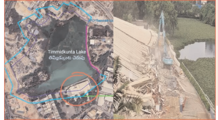
కొన్ని సంవత్సరాల కిందట, అప్పటి ప్రభుత్వ సర్వే ప్రకారం నిర్మించారని పేర్కొన్నారు. 2010-12 సంవత్సరాల్లో