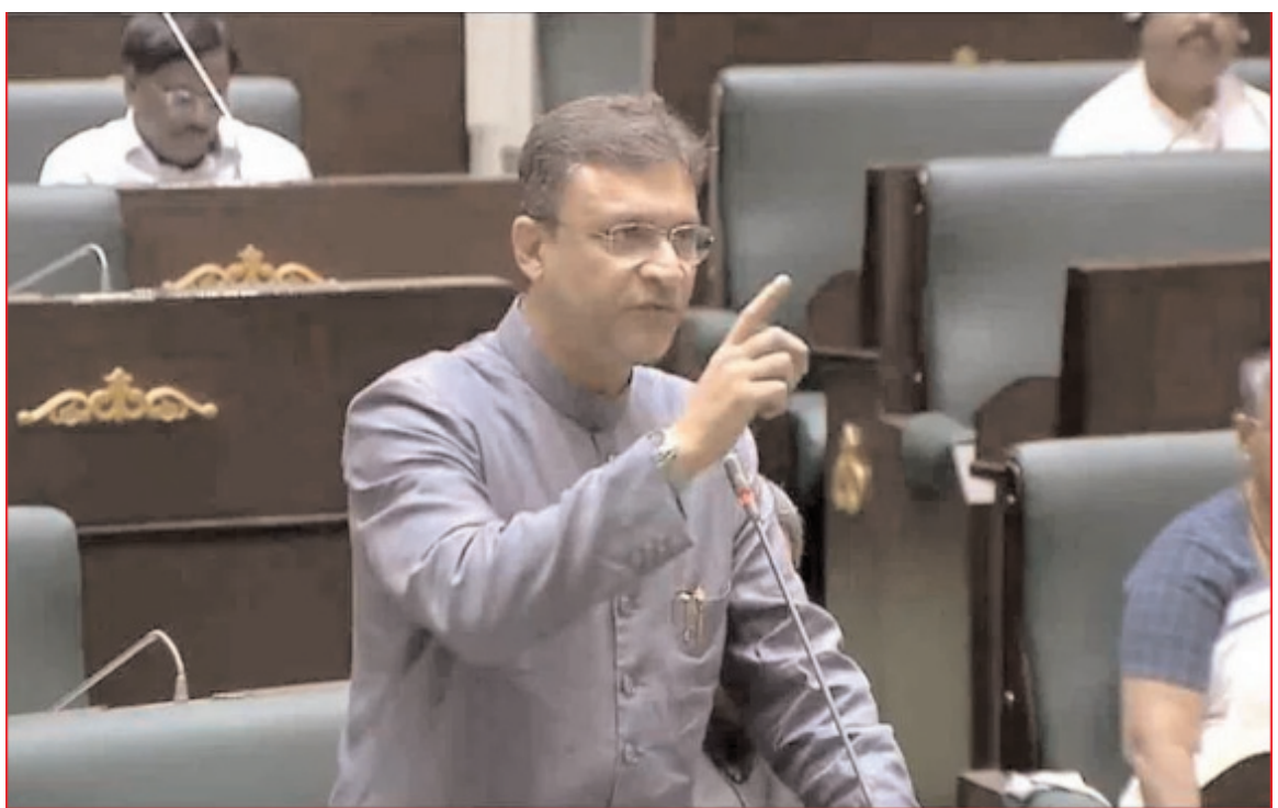
ఇయ్యాలి న్యూస్, హైదరాబాద్, ఆగస్టు 2: ప్రతిపక్ష పార్టీలు తీవ్ర ఆసంతృప్తి వ్యక్తం చేశాయి. ఎజెండా ఒకటి ఇస్తున్నారు, సభలో మండిపడ్డారు. ఈ అంశంపై ఎంబిఎం

ఎమ్మెల్యే అక్బరుద్దీన్ ఒవైసీ సభలో ప్రస్తావించారు. ఒక్క పాలిటికల్ పార్టీ కోరిక మీద, ఇష్టం మీద అసెంబ్లీ సదవకూడదు.. అందరిని పరిగణలోకి తీసుకోవాలి అని ఎమ్మెల్యే అక్బరుద్దీన్ ఒవైసీ ప్రభుత్వానికి సూచించారు. ప్రతి రోజు మాత్రం ఎజెండా ఒంటి గంటకు వస్తుంది.. మొన్న మాత్రం 1:40 గంటలకు వచ్చింది. అప్పుడు వస్తే సబ్జెక్ట్ మీద మేం ఎప్పుడు ప్రెజెంట్ కావాలి, 25 ఏండ్ల నా అనుభవంలో ఇలా సభ జరగడం నేను ఎప్పుడు చూడలేదు అని అక్బరుద్దీన్ ఒవైసీ పేర్కొన్నారు. శాసనసభ ఎజెండాపై అక్బరుద్దీన్ ఒవైసీ వ్యాఖ్యానించిన వ్యాఖ్యలను బీఆర్ఎస్ ఎమ్మెల్యే కేటీఆర్ సమర్థించారు. ఎజెండా ఎప్పుడు వస్తుందో తెలియని పరిస్థితి ఉందన్నారు. శాసనసభ ఎజెండాపై మిత్రపక్షంగా మీరు కూడా స్పందించకపోతే ఎలా అని సీపీఐ ఎమ్మెల్యే కూసననేని సాంబశివరావును ఎంబిఎం ఎమ్మెల్యే అక్బరుద్దీన్ ఒవైసీ కోరారు. మీకు ఎజెండా అయిన వస్తుంది.. మాకు అది కూడా రావడం లేదంటూ అక్బరుద్దీన్ ఒవైసీతో కూసననేని సాంబశివరావు అన్నారు.