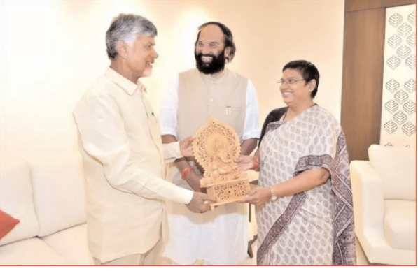
మధ్య సాగునీటి ప్రాజెక్టుల వివాదాలు, భవిష్యత్తుల పరిష్కారంపై చర్చించినట్లు ఆపశ్చక తదితరాలపైనా చర్చించినట్లు సమాచారం.

ఇయ్యాలి న్యూస్, ఏపీ, సెప్టెంబర్ 12:ఇరిగేషన్ మంత్రి ఉత్తమ్ కుమార్రెడ్డి, ఆయన భార్య ఎమ్మెల్యే పద్మావతి గురువారం అమరావతి వెళ్ళి ఆంధ్రప్రదేశ్ ముఖ్యమంత్రి చంద్రబాబునాయుడితో భేటీ అయ్యారు. ఇది మర్యాదపూర్వక సమావేశం మాత్రమేనని, నాలోసారి ఏపీ ముఖ్యమంత్రిగా బాధ్యతలు చేపట్టినందుకు అభినందనలు తెలిపామని మంత్రి ఉత్తమ్ ఒక ప్రకటనలో తెలిపారు. వీరిద్దరూ మధ్య భేటీ సందర్భంగా ఇరు రాష్ట్రాల రాజకీయ అంశాలు చర్చకు వచ్చినట్లు తెలిసింది. ఇటీవల కురిసిన వర్షాలు, వరదలతో రెండు తెలుగు రాష్ట్రాల జరిగిన నష్టాన్ని కూడా చర్చించుకున్నట్లు తెలిసింది. రెండు రాష్ట్రాల