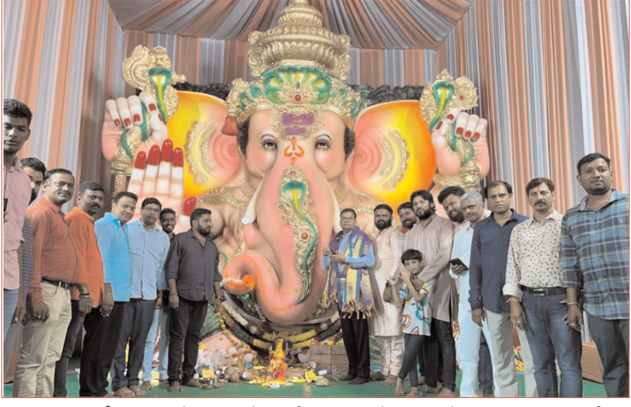
బాల్ అంబర్ పేట సీజా కాలనీలో ఏర్పాటు చేసిన గణేశ్ మండపంలో పూజలు చేస్తూ, అంబర్ పేట ఎమ్మెల్యే కాలేరు వెంకటేశ్ - ఇయ్యాలి న్యూస్, అంబర్ పేట, సెప్టెంబర్ 12