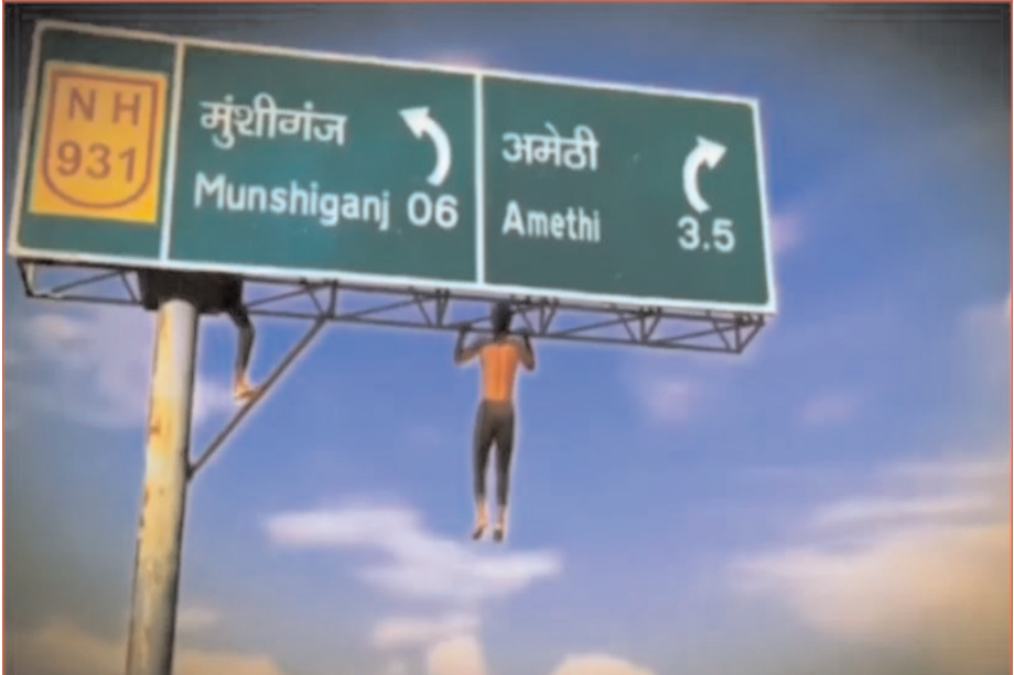
వీడికి సైత్యం ముదిరింది....

చేసేందుకు కూల్ డ్రింక్ ఉపయోగించారు. ఇందుకోసం ముందుగా స్ట్రావ్ పై పెద్ద ప్యాన్ పెట్టుకున్నారు.. అది వెడల్పైన తరువాత అందులో కూల్ డ్రింక్ పోశారు.. ఆ తరువాత కావాల్సినన్ని కోడి గుడ్లను కొట్టి పోశారు. వీటన్నింటినీ బాగా మిక్స్ చేశారు. అది బాగా వెడల్పి విక్రమదీన తరువాత దానిపై టమాటా, పచ్చిమిర్చి, కొత్తిమీర, పుదీనా, ఉప్పు కారం కావాల్సిన అన్నీ ఇంగ్లెండ్ యెంట్స్ వేసుకున్నారు.. చివరకు.. పోయ్యిపై ఈ మిక్చరూపంతో బాగా ఉడికించారు.. ఎగ్ బాగా ఉడికిన తరువాత దాన్ని వేడి వేడిగా తామరకు విస్త్రుతం సర్వ్ చేస్తున్నారు. ఇక సోషల్ మీడియాలో వీడియో చూసిన నెటిజన్లు షాక్ అవుతున్నారు. వామ్మో ఇదెక్కడి ప్రయోగంరా సామీ అంటూ నోరెళ్ళ బెదుతున్నారు. ఈ వ్యక్తి వైరల్ స్టేట్లో ఆమ్లెట్ను తయారు చేస్తున్నాడని మరికొందరు వాపోతున్నారు. అది ట్రోప్ చూద్దామని కూడా ఇప్పుడు చాలా మంది అక్కడికి వెళ్తున్నారు.