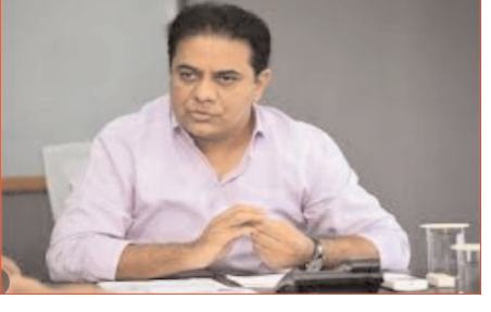
సందడి మొదలైంది.. మరీ మీ కళ్యాణమున్న కానుక అమలుకు సుముహూర్తం దొరకట్టేదా..? పది గ్రామాల పనికి ఆశజామీ ఆదాదార్ల ఓట్లు వేయించుకున్నా.. ఆడిన మాట తప్పి పచ్చని పందిళ్ల సాక్షిగా పచ్చి దగా చేస్తున్నా..! అంటూ కేటీఆర్ మండిపడ్డారు.

ఇయ్యాలి న్యూస్, హైదరాబాద్, అక్టోబర్ 16: కాంగ్రెస్ పార్టీ అధికారంలోకి రాగానే కళ్యాణలక్ష్మి, షాదీముబారక్ పథకం కింద ప్రతి ఆదాదార్ల పెట్టి తులం బంగారం ఇస్తామన్న హామీ ఏమైందని ముఖ్యమంత్రి రేవంత్ రెడ్డిని బీఆర్ఎస్ వర్గం ప్రెసిడెంట్ కేటీఆర్ నిలదీశారు. ఈ పది నెలల కాలంలో వేల సంఖ్యలో వివాహాలు జరగగా.. ఇప్పటి వరకు ఒక్కరికీ కూడా తులం బంగారం ఇవ్వలేదు. రాజీయే రోజుల్లో లక్షలాది పెట్టిళ్లు జరగడంతో ముఖ్యమంత్రి.. మరీ తులం బంగారం మాట ఎంటని రేవంత్ కేటీఆర్ ప్రశ్నించారు. ఈ అంశంపై కేటీఆర్ ఎక్స్ వేదికగా రేవంత్ కు నిలదీశారు. లక్షలాది లాగాలు జరిగే మ్యూజీ సిజన్ మళ్లీ వచ్చింది.. ఈ సారి కూడా తులం బంగారం తూనే తూనేనా ముఖ్యమంత్రి..? అని కేటీఆర్ ప్రశ్నించారు. శుభ ముహూర్తాలతో పెళ్లి