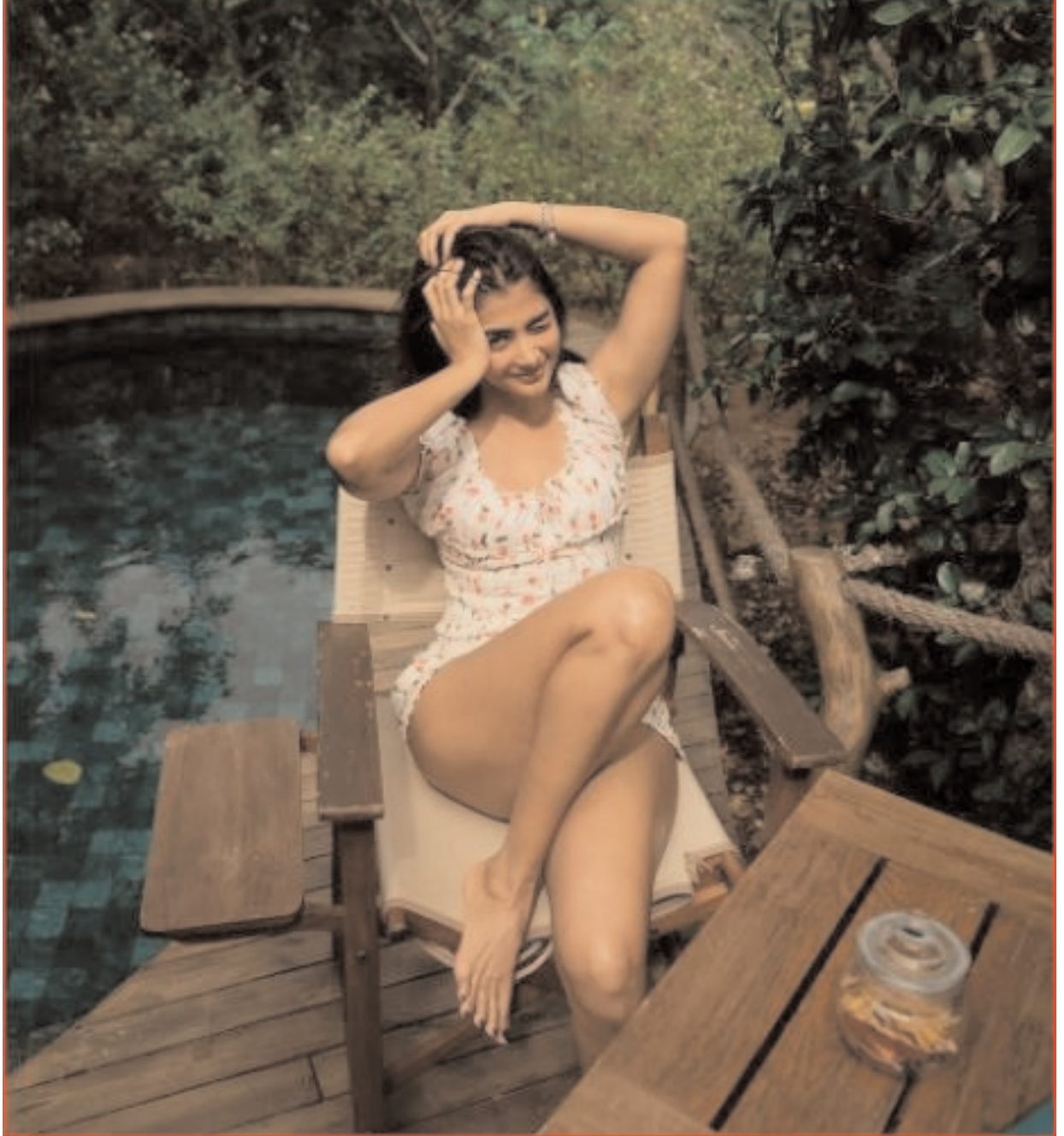
రిలాక్స్ మోడ్ లో పూజా హెగ్డే.. థండర్ థైస్ చూపిస్తూ గ్లామర్ ట్రీట్

ఇయ్యాల్టి న్యూస్, సిన్మా, అక్టోబర్ 16: టాలీవుడ్ యాంకర్ అనసూయ ఫోటోలు ఎప్పటికప్పుడు సోషల్ మీడియాలో వైరల్ అవుతూనే ఉంటాయి.. న్యూస్ రీడర్ గా ఎంఠ్రీ ఇచ్చి జబర్దస్త్ యాంకర్ గా ఒక వెలుగు వెలిగిన యాంకర్.. అనసూయ. జబర్దస్త్ నుంచి బయటకొచ్చాక వరుస సినిమాలతో ఫుల్ బిజీ అయ్యింది యాంకర్ అనసూయ.. అప్పుడప్పుడు టీవీలో కనిపిస్తూన్నా అనసూయ సోషల్ మీడియాలో మాత్రం ఎప్పటికప్పుడు ఫోటోలు షేర్ చేస్తూ ట్రెండ్ అవుతూనే ఉంటారు.. ఇక అలానే ఇప్పుడు కూడా తన లైఫ్ స్టైల్ కు సంబంధించి కొన్ని ఫోటోలు షేర్ చేయగా అవి వైరల్ గా మారాయి.