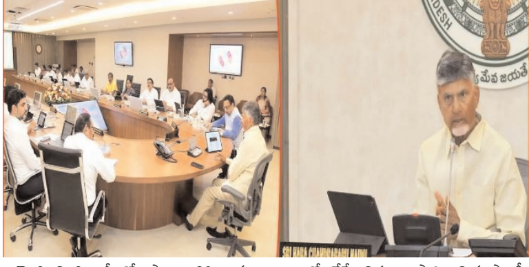
ఆమోదించింది. దీంతో పాటు 20 లక్షల ఖాతాలో వేసి విదంగా పారిశ్రామిక పాలసీ ఉద్యోగాలు కల్పనే లక్ష్యంగా పారిశ్రామిక ఉండాలని కాబినెట్ నిర్ణయించింది. ఇక, ఏపీ పాలసీ, పారిశ్రామిక ప్రోత్సాహకాలను ఎన్ఫోర్స్ ఫుడ్ ప్రాసెసింగ్ పాలసీ పైనా రాష్ట్ర

ఇయ్యాలి న్యూస్, ఏపీ, అక్టోబర్ 16: ఆంధ్ర ప్రదేశ్ రాష్ట్ర సచివాలయంలో మంత్రివర్గ సమావేశం నిర్వహించారు. బుధవారం ముఖ్యమంత్రి చంద్రబాబు అధ్యక్షతన ఈ భేటీ జరిగింది. అయితే, మాదక ద్రవ్యాలకు అడ్డుకట్ట, అక్రమ మద్యం అమ్మకాలు అరికట్టడం, రీహాబిలిటేషన్ పై మంత్రి వర్గ ఉప సంఘం ఏర్పాటు చేసేందుకు ఆమోదం తెలిపింది. ఇక, రాష్ట్రంలో పునరుద్ధాదక విద్యుత్, పంప్ స్టోరేజీ ద్వారా విద్యుత్ ఉత్పత్తి, గ్రీన్ హైడ్రోజన్ లాంటి వనరుల వినియోగం పెంచేలా ఏపీ క్షీన్ ఎనర్జీ పాలసీకి కేబినెట్ ఆమోదం తెలిపింది. అలాగే, 2024-29 రాష్ట్ర పారిశ్రామికాభివృద్ధి పాలసీ 4.0పై చర్చించిన మంత్రివర్గం