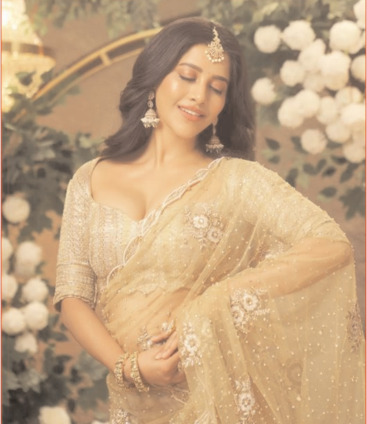
బంగారపు వర్ణం చీరలో.. బంగారంలా మెరిసిపోతూ నభా నటేష్..

ఇయ్యాల్టి న్యూస్, సిన్మా, అక్టోబర్ 16: టాలీవుడ్ స్టారో హీరోయిన్ పూజా హెగ్డే లేటెస్ట్ ఫోటోలతో సోషల్ మీడియాలో ట్రెండింగ్ లో ఉంటారు. తాజాగా బీచ్ లో రిలాక్స్ అవుతూ స్టైలిష్ లుక్ లో ఆమె తాజాగా జరిపిన ఫోటోషూట్ ఇన్స్టాగ్రామ్ లో వైరల్ అవుతున్నది. ట్రెండ్ అవుతున్న అందాల భాష ఫోటోలపై మీరు ఓ లుక్కేయండి