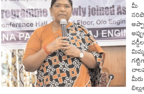
నెల సగటున 6 వేల కోట్ల ప్రజాధనాన్ని మీ అప్పుల కుప్పను కడగడానికి సరిపోతుందని తెలిపారు. అప్పుల అపౌరావు లాగా అందిన కాదల్లా అప్పులు చేసి.. రాష్ట్రాన్ని తిప్పలు పెట్టి, వడ్డీలతో ఆర్థిక వ్యవస్థ నడ్డి విరిచిన మిమ్మల్ని దేనితో కొట్టాలంటూ కాస్త గట్టిగానే రాసుకొచ్చారు. అప్పులు కాలవల్లంపై వేల కోట్ల బకాయిలు మీరు చెల్లించలేదని, చేసిన పనులకూ బిల్లులు చెల్లించలేదంటూ ధ్వ

ఇయ్యాలి న్యూస్, హైదరాబాద్, అక్టోబర్ 16: మంత్రి సీతక్క తాజాగా సోపర్ మీడియాలో గత ప్రభుత్వంపై తీవ్ర విమర్శలు చేసింది. ఇందులో భాగంగా.. తొమ్మిదవరేళ్లలో మీరు చేసిన అప్పులకు వడ్డీలు కట్టడానికి కొత్త అప్పులు చేయాలని దుస్థితిని తీసుకొచ్చారని, అప్పుల వారసత్వానికి ఆద్యుడే మీరేనని అవినా అన్నారు. మీ హయాంలో అక్షరాల రూ. 7 లక్షల కోట్ల అప్పులు చేసారని, వాటికి వడ్డీలు, వడ్డీల కోసం ప్రతి రోజు టులంపూ రూ.207 కోట్లు చెల్లించాల్సి వస్తోందని, అంటే.. ప్రతి