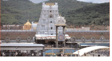
చేయనుంది. అలాగే.. మధ్యాహ్నం 3 గంటలకు వర్షవల్ల సేవ టికెట్లు విడుదల చేయనుంది. 23వ తేదీ ఉదయం 10 గంటలకు అంగప్రదక్షణ దర్శన టిక్కెట్లు విడుదల కానున్నాయి. ఉదయం 11 గంటలకు శ్రీవాణి దర్శన టికెట్లు విడుదల చేయనున్నారు. మధ్యాహ్నం 3 గంటలకు పయోవృద్ధులు, వికలాంగుల దర్శన టికెట్లు విడుదల చేయనుంది టిటీడీ. 24వ తేదీ ఉదయం 10 గంటలకు 300 రూపాయల ప్రత్యేక ప్రవేశ దర్శన టికెట్లు విడుదల కానున్నాయి. మధ్యాహ్నం 3 గంటలకు వసతి గదులు కోటా విడుదల చేయనుంది టిటీడీ.

ఇయ్యాలి న్యూస్, ఏపీ, అక్టోబర్ 16: తిరుమల వెళ్లే షానింగిలో ఉన్న వారికి అదే గుడ్ న్యూస్. ఏంటని అనుకుంటున్నారా.. శ్రీవారి దర్శన టికెట్లు బుకింగ్ కు రెడీగా ఉండండి. జనవరి నెల టికెట్లు విడుదల కానున్నాయి. అందువల్ల మీరు జనవరి నెలలో కొండకు వెళ్లాలని చూస్తే.. మాత్రం టికెట్లు విడుదల అయిన వెంటనే బుక్ చేసుకోవడం ఉత్తమం. ఈ నెల 19వ తేదీ సుంచి 23వ తేదీ వరకు ఆన్లైన్లో జనవరి నెలకు సంబంధించిన దర్శన టికెట్లు విడుదల చేయనుంది తెలుమల తిరువతి దేవస్థానం (టీటీడీ).. మీరు తిరుమల వెళ్లాలని అనుకుంటే మాత్రం ఈ టికెట్లు అలా పచ్చి ఇలా అయిపోతాయి. అంత ఫాస్ట్గా బుక్ చేసుకుంటారు. 19వ తేదీ సుంచి 21వ తేదీ ఉదయం వరకు లక్ష్మీ దిష్ విధానంలో కేటాయింపు ఆర్డీతో సేవ టికెట్లు విడుదల చేయనున్నారు. 22వ తేదీ ఉదయం 10 గంటలకు కళ్యాణోత్సవం, ఉంజల్ సేవ, ఆర్డీత బ్రాహ్మణ్యం, సహస్రదీపాలంకరణ సేవ టికెట్లును టిటీడీ విడుదల