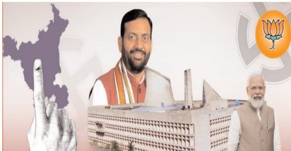
బీజేపీకి ప్రజల మద్దతు

ఇయ్యాలి న్యూస్, వెబ్ డెస్క్, అక్టోబర్ 8: హరియాణాలో మరోసారి కమలం విజయం సాధించింది. ఎగ్జిట్ పోల్స్ అంచనాలను తలకిందులు చేస్తూ బీజేపీ ముచ్చటగా మూడోసారి అధికారాన్ని చేజిక్కుకుంది. మొత్తం 90 అసెంబ్లీ నియోజకవర్గాలు గానూ 48 స్థానాలు గెలుచుకొని బీజేపీ హయానికి కొత్తింది. ప్రతిపక్ష పార్టీ కాంగ్రెస్ 36 సీట్లు కైవసం చేసుకుంది. ఐఎన్?ఎల్?డి రెండు స్థానాల్లో, ఇతరులు మూడు స్థానాల్లో గెలుపొందారు. ఆమ్ ఆర్ఎస్ పార్టీ ఖాతానే తెరవలేదు. కొండింగ్ ఆరంభంలో ముందంజలో ఉన్న కాంగ్రెస్, కొద్దిసేపటికే రెండో స్థానానికి పరిమితమైంది.