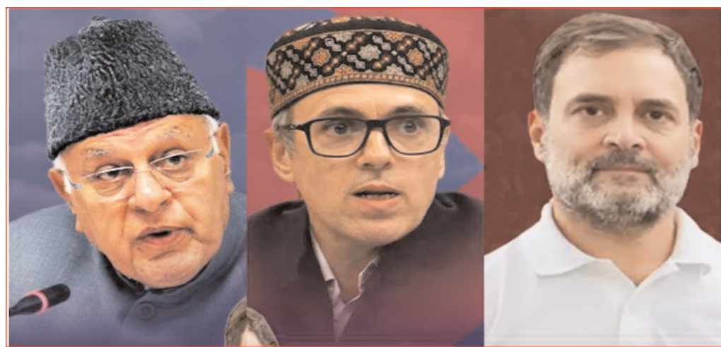
మాలిక్ - బీజేపీ అభ్యర్థిపై గజయ్ సింగ్ రాజాపై 4,538 ఓట్ల ఆధిక్యంతో విజయం సాధించారు. మొత్తానికి జమ్మకశ్మీర్లో అందుకు భిన్నంగా ఎన్నికల ఫలితాలు వెలువడ్డాయి.

ఇయ్యాలి న్యూస్, వెబ్ డెస్క్, అక్టోబర్ 8: ఆర్థిక 370 రద్దు తర్వాత జమ్మకశ్మీర్లో తొలిసారి జరిగిన ఎన్నికల్లో నేషనల్ కాన్గ్రెస్- కాంగ్రెస్ కూటమి విజయం సాధించింది. మ్యూజిక్ ఫిగర్ కన్నా రెండు సీట్లు ఎక్కువగా గెలుచుకుంది. ఎన్?సీ 42 సీట్లు, కాంగ్రెస్ 6 స్థానాల్లో విజయం దుందుభి మోగించాయి. బీజేపీ 29 సీట్లను సొంతం చేసుకుంది. పీడీపీ మూడు స్థానాలకు పరిమితమైంది. 10 స్థానాల్లో ఇతరులు గెలుపొందారు. అందులో ఒకరు ఆమ్ అభ్యర్థి ఉన్నారు. ఆర్థిక 370 రద్దు, కేంద్ర పాలిత ప్రాంతంగా మార్చు వంటి నిర్ణయాల నేపథ్యంలో జరిగిన ఎన్నికల్లో జమ్మకశ్మీర్ ప్రజలు ఎన్సీ-కాంగ్రెస్ కూటమివై మొగ్గు చూపారు. పూర్తి స్థాయి రాష్ట్ర హోదా సాధనకు కృషి చేస్తామన్న వాగ్దానాన్ని నమ్మి- ఆ రెండు పార్టీలకే పట్టం కట్టారు. పీడీపీ కూడా ఇలాంటి హామీలే ఇచ్చినా- గతంలో బీజేపీతో జట్టు కట్టడం వంటి పరిణామాల నేపథ్యంలో ఆ పార్టీని నమ్మలేదు. చరిత్రలో తొలిసారి జమ్మకశ్మీర్ శాసనసభ ఎన్నికల్లో గెలుపొందింది ఆమ్. దోదా నియోజకవర్గం నుంచి ఆమ్ టికెట్పై పోటీ చేసిన మెహ్రజ్