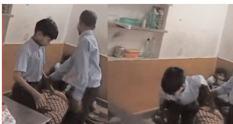
పాఠశాలలో ఉపాధ్యాయురాలు నేలపై పిల్లలతో మసాజ్ చేయించుకోవడంతో సర్వత్రా విమర్శలు వ్యక్తమవుతున్నాయి. ఈ వీడియో చూసిన నెటిజన్లు తీవ్రంగా ఆగ్రహం వ్యక్తం చేస్తున్నారు. ఇలా పిల్లలతో మసాజ్

ఇయ్యాలి న్యూస్, వెబ్ డెస్క్, అక్టోబర్ 11: పాఠశాల అంటే విద్యార్థులు కొత్త విషయాలు నేర్చుకునే దేవాలయం.. కానీ అలాంటి పాఠశాలలో కొందరు ఉపాధ్యాయులు చేస్తున్న పనులు ఉపాధ్యాయ వృత్తికి మన్న తెస్తున్నాయి. కొందరు ఉపాధ్యాయులు ఉపాధ్యాయ వృత్తిని దుర్వినియోగం చేస్తున్న వీడియోలు ఈమధ్య మనం సోషల్ మీడియాలో చూస్తునే ఉన్నాం.. తాజాగా ఇలాంటి సంఘటన ఒక్కటి నెటింట్లో చక్కర్ కొడుతుంది. ఓ ప్రభుత్వ పాఠశాలలో నేలపై వదులుకుని ఒక ఉపాధ్యాయురాలు విద్యార్థులతో మసాజ్ చేయించుకోవడం సంబంధంగా మారింది. ఈ ఘటన రాజస్థాన్ రాష్ట్రంలోని జైపూర్ లో చోటుచేసుకుంది. కర్నాటకలోని ప్రభుత్వ హయ్యర్ ప్రైమరీ స్కూల్లో ప్రభుత్వ