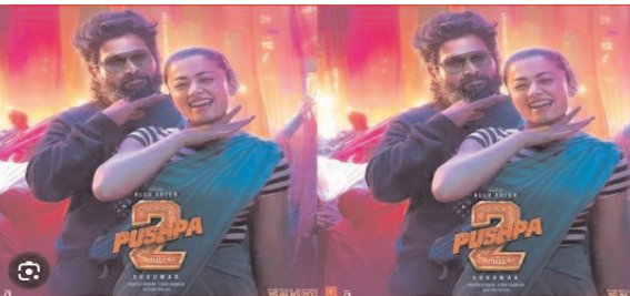
ప్రొడక్షన్ లో ఉన్నప్పుడే ఒక సినిమా ఆల్ లాంగ్ వేజ్స్ థియేట్రీకల్ హక్కులు, ఓవర్సీస్, డిజిటల్, శాటిలైట్, మ్యూజిక్ ఇలా అన్ని రైట్స్ హాట్ కేక్ లా. క్రేజీ, ఫ్యాన్స్ అవోంట్ కు అమ్ముడుపోయిన చిత్రం పుష్ప-2నే అని క్రేడ్ వర్గాల్లో

ఇయ్యాల్టి న్యూస్, సిన్మా, అక్టోబర్ 11: అల్లు అర్జున్-సుకుమార్ కలయికలో తెరకెక్కిన చిత్రం పుష్ప ది రైజ్ తెలుగులో పాటు పాన్ ఇండియా స్థాయిలో ఎంతటి ఘన విజయం సాధించిందో ప్రత్యేకంగా చెప్పనక్కర్లేదు. తగ్గేదేలే అంటూ ఈ సినిమాలో పుష్ప రాజ్ నటనకు అందరూ ఫిదా అయ్యారు. ఈ చిత్రంలో తన నటనకు ఉత్తమ నటుడిగా అల్లు అర్జున్ జాతీయ పురస్కారం కూడా అందుకున్న సంగతి తెలిసిందే. ఇప్పుడు ఈ చిత్రానికి సీక్వెల్ గా అదే క్రేజీ కాంట్రాక్ట్ చేసింది, అత్యంత భారీ బడ్జెట్ తో రూపొందుతున్న చిత్రం పుష్ప-2 ది రూల్. మైత్రీ మూవీ మేకర్స్ తో కలిసి సుకుమార్ రైటింగ్స్ సంస్థ నిర్మిస్తున్న ఈ చిత్రం డిసెంబరు 6న ప్రపంచవ్యాప్తంగా విడుదల కానుంది. ప్రస్తుతం ఒకవైపు షూటింగ్.. మరో వైపు పోస్ట్ ప్రొడక్షన్ కార్యక్రమాలతో పుష్ప-2 టీమ్ బిజీగా వుంది. ఇక అసలు విషయానికొస్తే... ప్రస్తుతం పుష్ప-2 చిత్రం ష్రీ రిలీజ్ బిజినెస్ డ్రీమ్ వర్గాల్లో హాట్ టాపిక్ గా మారింది.