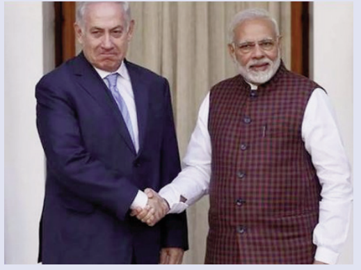
వారితో భారత రామబాబ్ కార్యాలయం సంప్రదింపులు జరుపుతోందని శనివారం విదేశాంగ మంత్రిత్వ శాఖ ప్రతినిధి రణధీర్ జైస్వాల్ తెలిపారు.

ఇయ్యూజి న్యూస్, ఢిల్లీ, నవంబర్ 27: ఇజ్రాయెల్-లెబనాన్ మధ్య జరుగుతున్న యుద్ధానికి ముగింపు పడింది. గత కొద్ది రోజులుగా యుద్ధంతో ఇరు దేశాల మధ్య ఉద్రిక్తతలతో అట్టుడికాయి. క్రీపటి, బాంబు దాడులతో రెండు దేశాలు దద్దరిల్లా. మొత్తానికి అమెరికా జోక్యంతో కాల్పులకు ఫుల్ స్టాప్ పడింది. అటు అమెరికా.. ఇటు ఇజ్రాయెల్ కు కూడా యుద్ధం ఆపేస్తున్నట్లు ప్రకటించాయి. దీంతో ఇజ్రాయెల్ నిర్ణయాన్ని భారత్ స్వాగతించింది. కాల్పుల విరమణకు ఇజ్రాయెల్ తీసుకున్న నిర్ణయాన్ని స్వాగతిస్తున్నట్లు భారత్ ప్రకటించింది. ఇరు దేశాల నిర్ణయాన్ని స్వాగతిస్తున్నట్లు భారత్ విదేశాంగ మంత్రిత్వ శాఖ ఒక ప్రకటనలో తెలిపింది. ఈ నిర్ణయం పశ్చిమాసియాలో ఉద్రిక్తతలను తగ్గిస్తుందని పేర్కొంది. తాజా నిర్ణయంతో శాంతి నెలకొంటుందని.. పరిస్థితులు సాధారణ స్థితికి వస్తాయని అభిప్రాయపడింది. ఇక ఇజ్రాయెల్లో భారతీయ పౌరులంతా క్షేమంగా ఉన్నారని..