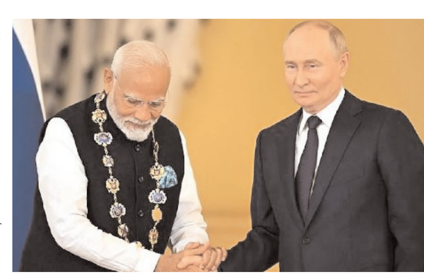
పల్లవుడు సిద్ధంగా ఉంటుంది” అని ప్రధాని మోదీ అన్నారు.

ఇయ్యాలి న్యూస్, వెబ్ డెస్క్, నవంబర్ 19: రష్యా అధ్యక్షుడు వ్లాదిమిర్ పుతిన్ త్వరలో భారత్ సందర్శించేందుకు క్రెమ్లిన్ మంగళవారం తెలిపింది. మాస్కో-న్యూఢిల్లీ వెళ్లడం విషయం పుతిన్ తన పర్యటనలో ప్రధాని నరేంద్రమోదీని కలవనున్నారు. అక్టోబర్ చివరలో బ్రిక్స్ సదస్సులో ఇరువురు నేతలు కలిశారు. ఈ పర్యటన సందర్భంగా పుతిన్ భారత్లో పర్యటించాల్సిందిగా ప్రధాని మోదీ ఆహ్వానం పంపారు. రష్యా-ఉక్రెయిన్ సమస్యని ప్రస్తావిస్తూ.. శాంతియుత పరిష్కారాన్ని భారత్ విశ్వసించిందని మోదీ పుతిన్ కి తెలియజేశారు. “రష్యా-ఉక్రెయిన్ యుద్ధంలో శాంతి వర్గాలతో టచ్లో ఉన్నాము. అన్ని వివాదాలను చర్చలతో పరిష్కరించుకోవాలనేది మా వైఖరి. వివాదానికి శాంతియుత పరిష్కారాలను మేము విశ్వసించుచున్నాము. శాంతిని నెలకొల్పడానికి భారత్