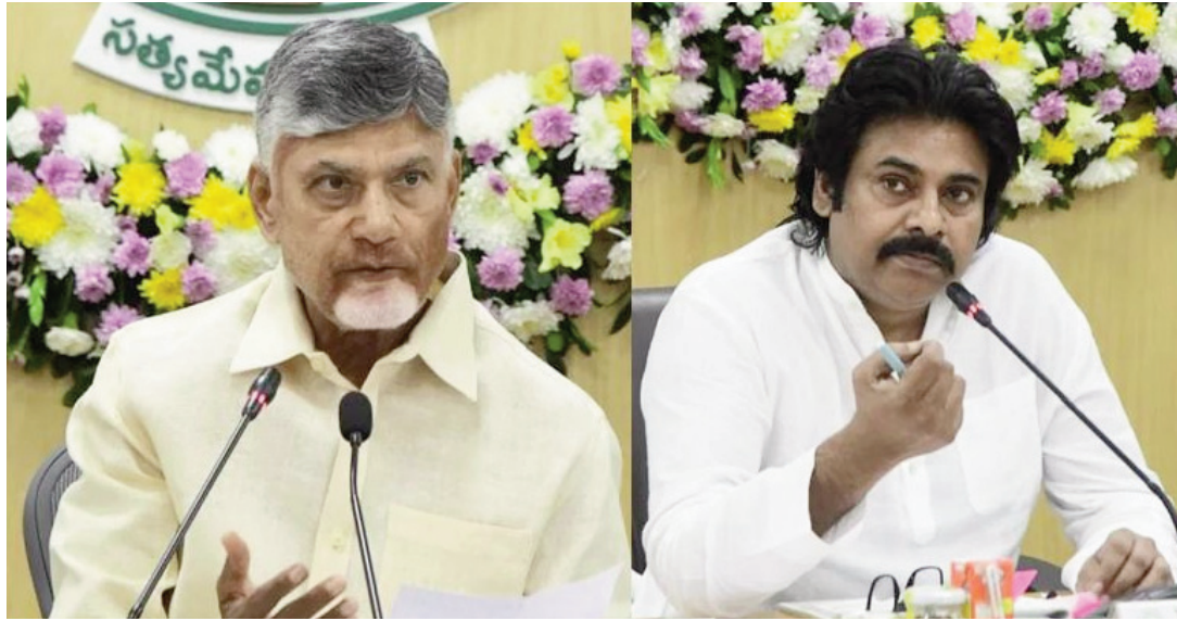
ఉద్యోగిస్తున్నట్లు లక్ష్యాన్ని ప్రభుత్వం పనిచేస్తుందన్నారు. మరోవైపు జిల్లాల్లో రేషన్, గంజాయి, ప్రగ్నీ మాఫియాను కూకటి వేళ్లతో పెకిలించాలని కలెక్టర్లకు ఆదేశించారు చంద్రబాబు. 2027కల్లా పోలవరం పూర్తి చేయాలనే లక్ష్యంతో ముందుకెళ్తున్నామన్నారు. ఇటీవల ఐటీ మంత్రి అమెరికా చర్యలను సందర్భంగా విశాఖలో గూగుల్ సంస్థ పెట్టుబడులు పెట్టేందుకు ముందుకొచ్చిందని.. దీంతో ఉద్యోగ అవకాశాలు భారీగా పెరుగుతాయని సీఎం చంద్రబాబు తెలిపారు.

అయ్యాలి న్యూస్, ఏపీ, డిసెంబర్ 11: గత ప్రభుత్వ హయాంలో రాష్ట్రంలో ప్రగ్నీ, గంజాయి, బియ్యం మాఫియా పెరిగిపోయిందని ఆంధ్రప్రదేశ్ ముఖ్యమంత్రి చంద్రబాబు నాయుడు పేర్కొన్నారు. ఇకపై ఏ జిల్లాలో అయినా బియ్యం, గంజాయి మాఫియా పై కఠిన చర్యలు తీసుకోవాలని కలెక్టర్లకు, ఎస్పీలకు.. సీఎం చంద్రబాబు ఆదేశించారు.. గాడి తప్పిన రాష్ట్రాన్ని గాడిలో పెట్టేందుకు తీవ్రంగా ప్రయత్నిస్తున్నామని.. ఇందుకోసం ప్రతి ఒక్క అధికారి సీరియస్ గా పని చేయాలని చంద్రబాబు సూచించారు.. రెండు రోజులపాటు నిర్వహించే కలెక్టర్ల, ఎస్పీల సదస్సును బుధవారం సీఎం చంద్రబాబు ప్రారంభించారు. కొన్ని సూచనలు.. ఇంకొన్ని సలహాలు.. మరికొన్ని బాధ్యతలు గుర్తించేస్తూ కలెక్టర్లతో మొదటిరోజు భేటీ కొనసాగింది. హార్డ్ వర్క్ కాదు.. స్మార్ట్ గా దూసుకుపోవాలని ప్రధానంగా కలెక్టర్లకు సూచించారు సీఎం చంద్రబాబు.. పెట్టుబడుల కోసం పొరుగు రాష్ట్రాలతో పోటీ పడనక్కర్లే.. అభివృద్ధిలో జిల్లాల కలెక్టర్లకు పోటీపడాలన్నారు. అభివృద్ధిలో సంపద వస్తుందని.. అదే సంపదలో అభివృద్ధి సాధ్యమవుతుందన్నారు. ప్రతి సంక్షోభంలోనూ అవకాశాలుంటాయని.. వాటిని వెతుక్కోవడమే నాయకత్వమన్నారు. అమరావతి, పోలవరం ప్రాజెక్ట్ నిర్మాణాలు, విజన్ 2047పై కలెక్టర్లకు, ఎస్పీలకు చంద్రబాబు దిశానిర్దేశం చేశారు. విజన్-2047 సాధన కోసం 20కి పైగా పాలీసీలు తీసుకోవాలని సీఎం చంద్రబాబు వివరించారు. రాష్ట్రస్థాయిలో పాటు జిల్లా, నియోజకవర్గ స్థాయిలోనూ ఈ విజన్ అమలు కావాలన్నారు. 20లక్షల మందికి